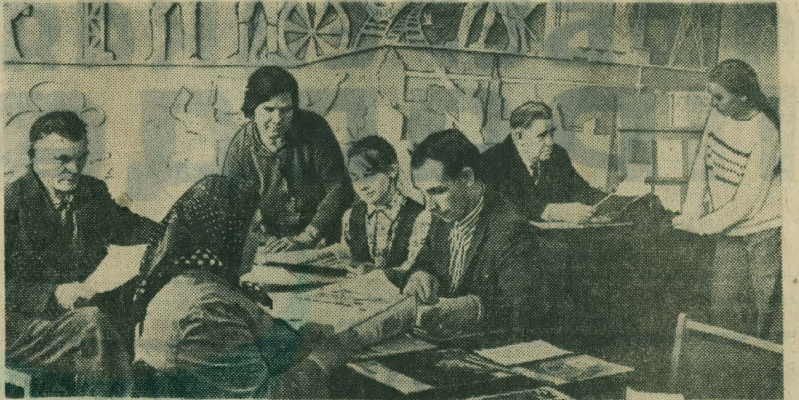
Охотно приходят труженики Люберецкого комбината строительных материалов и конструкций в клуб избирателей, расположенный в Доме агитатора, почитать свежие газеты и журналы, депутаты Верховного Совета РСФСР и местные Советы депутатов трудящихся. Здесь установлено дежурство агитаторов, и каждый, кто приходит сюда, может получить нужную справку.

НА СНИМКЕ: агитаторы беседуют с избирателями, пришедшими в свой клуб.