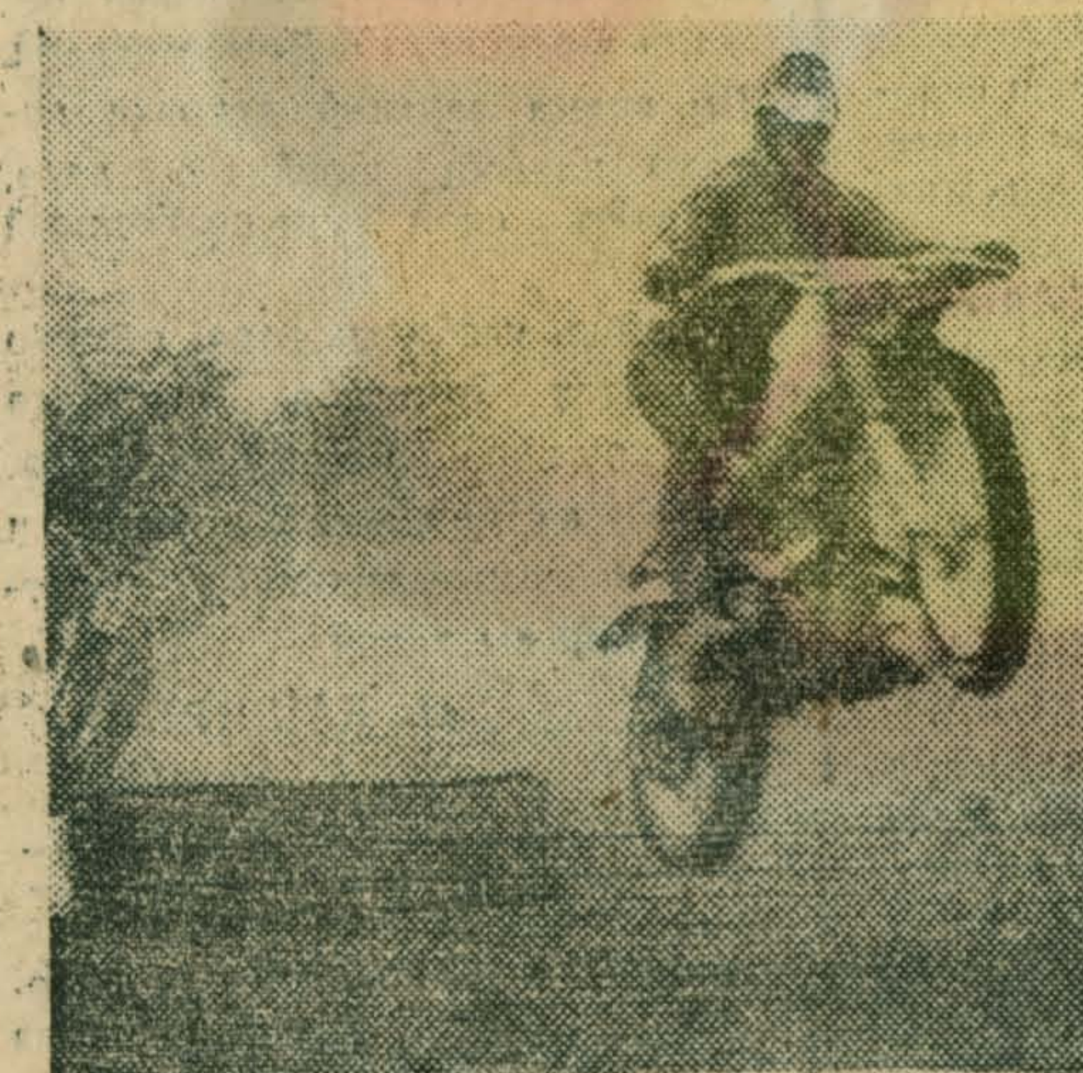
С ТРАМПЛИНА НА МОТОЦИКЛЕ