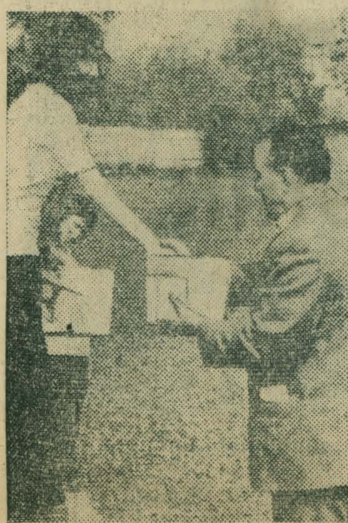
Награды — победителям