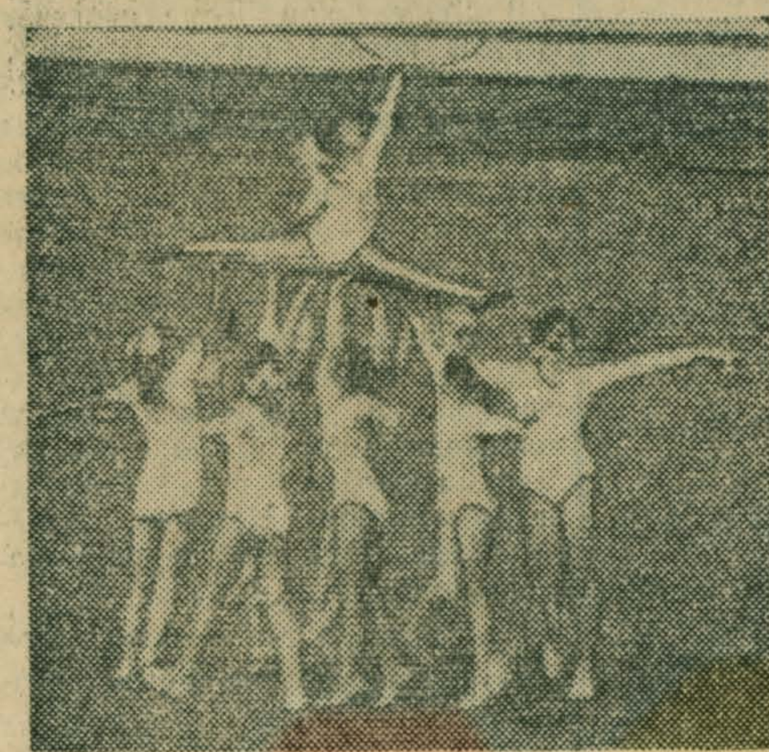
На стадионе юные гимнастки