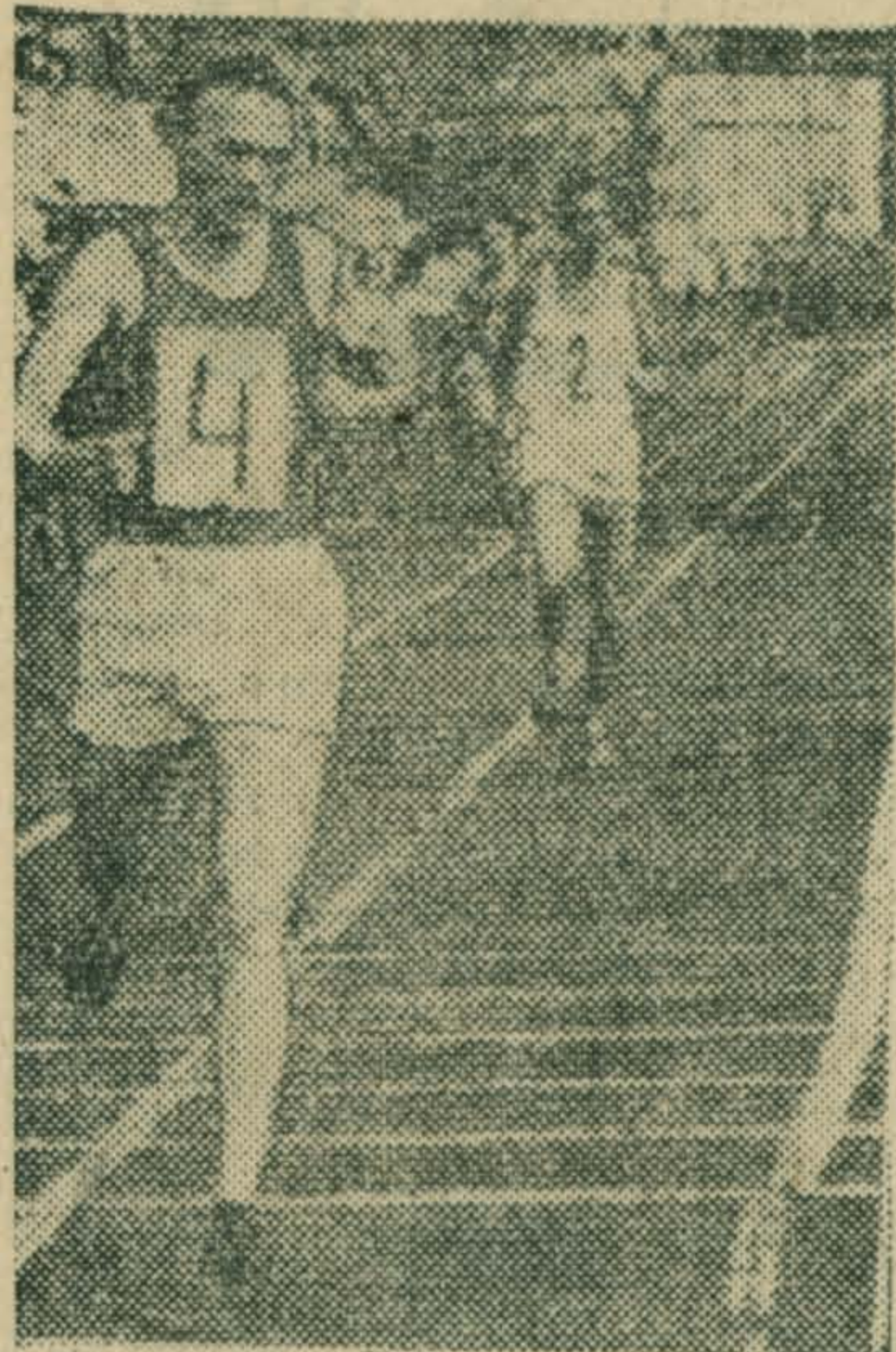
Легкоатлеты на этапе

Таким днем было 9 мая. На стадионах, спортивных площадках, на улицах города прошли в этот день соревнования, посвященные 30-летию Победы. Об этом дне наш рассказ.