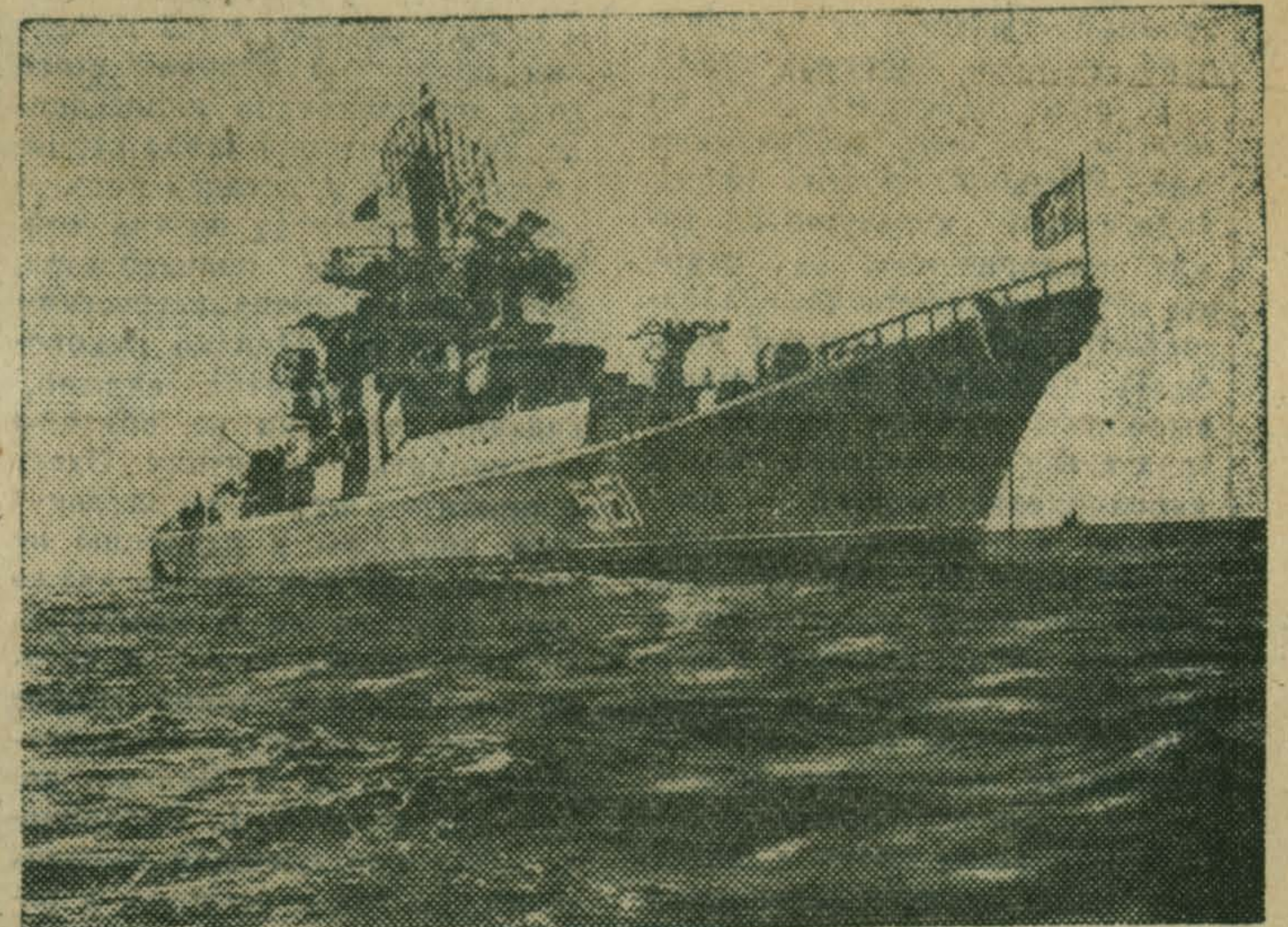
Вся боевая и политическая учеба на Краснознаменном Тихоокеанском флоте, морские походы, марши морской пехоты, сложные стрельбы артиллеристов и ракетчиков, проходившие в эти дни, посвящены 30-летию Великой Победы.

НА СНИМКЕ: большой противолодочный корабль «Адмирал Октябрьский» — один из новейших ракетных кораблей флота.