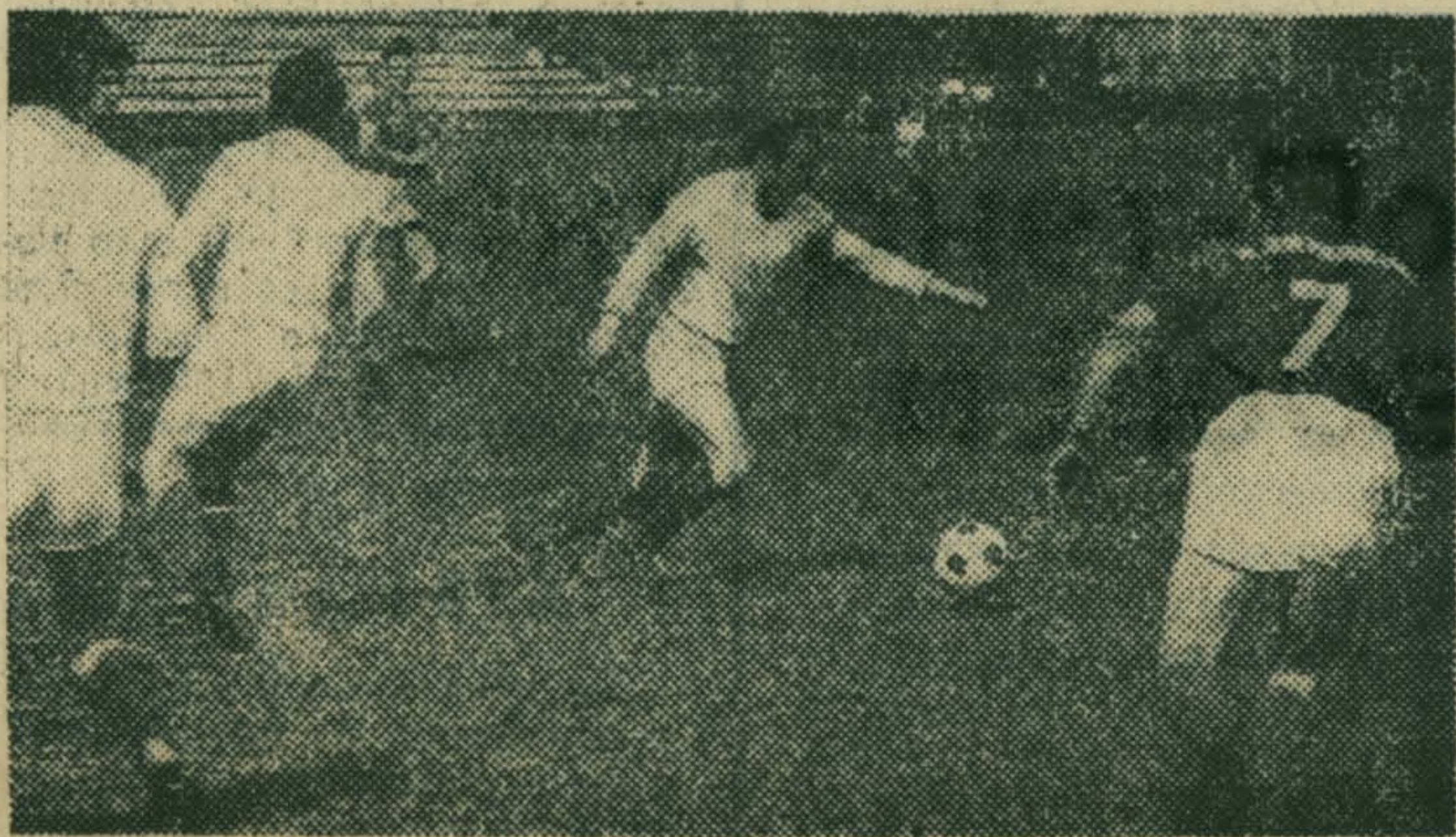
Наступила футбольная пора. На стадионах, спортивных площадках проходят соревнования, товарищеские встречи. На этом снимке вы видите момент финальной игры на приз открытия сезона. Встречались команды завода им. Ухтомского и поселка Держинского. Победили держинцы со счетом 3:0.

Финалистам вручены грамоты, дипломы.