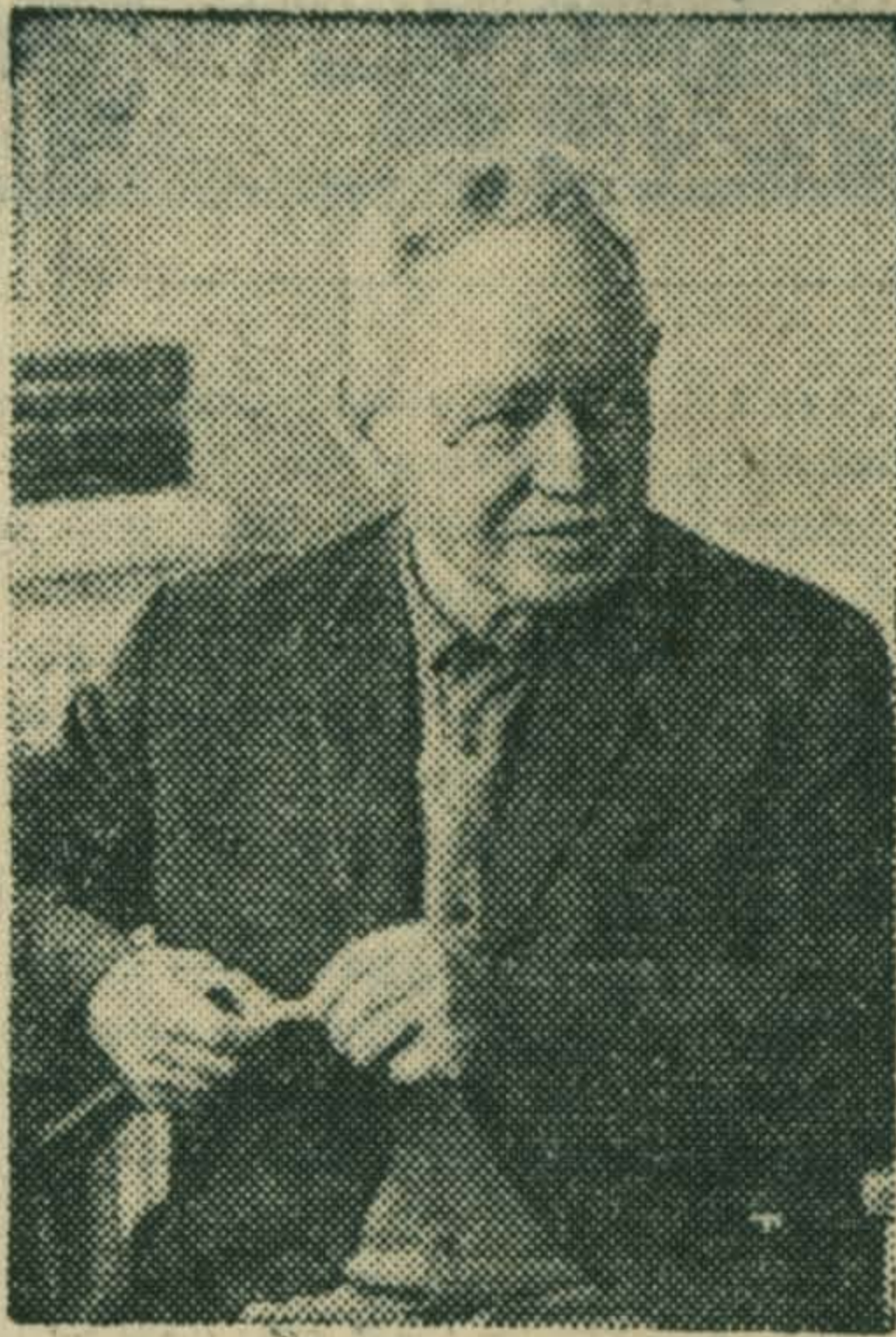
Сотни миллионов людей земли читают замечательные книги Михаила Александровича Шолохова — выдающегося советского писателя, Героя Социалистического Труда, академика, лауреата Ленинской и Нобелевской премий. Художника-коммуниста по праву называют летописцем нашей героической эпохи, впечатляюще показавшим победную силу великих идей ленинизма. Зоркий писатель-реалист обращается в своем творчестве к определяющим этапам развития советского общества.

Сегодня исполняется 70 лет со дня рождения