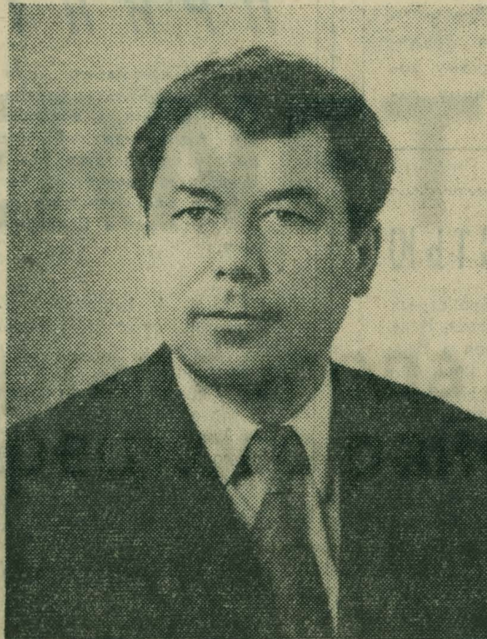
ПО ЛЮБЕРЕЦКОМУ ГОРОДСКОМУ ИЗБИРАТЕЛЬНОМУ ОКРУГУ № 63