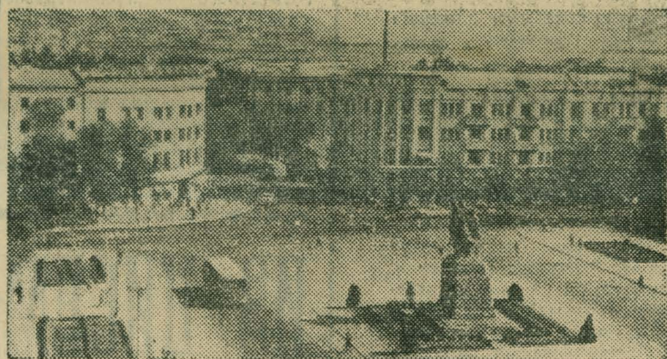
Новороссийск. Площадь Свободы