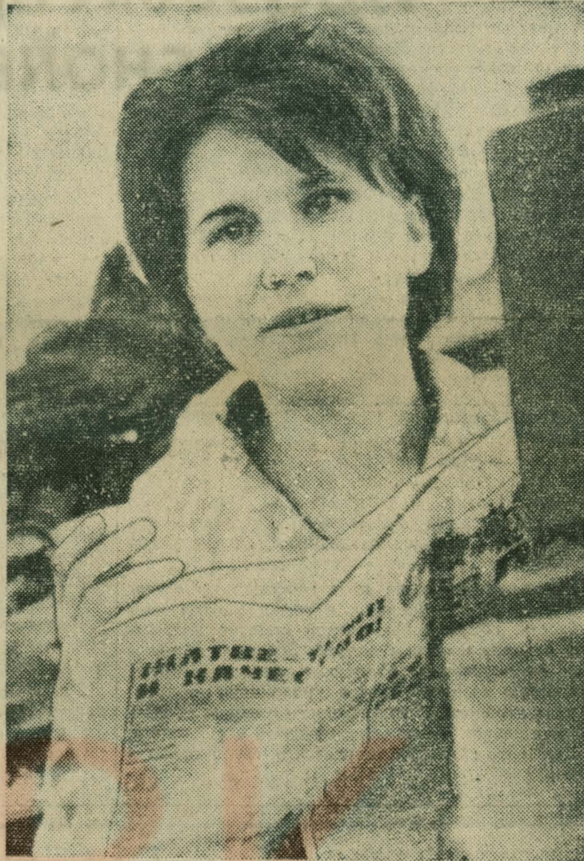
ПО СЛЕДАМ НАШИХ ВЫСТУПЛЕНИЙ

член сектора партийной информации ГК КПСС.