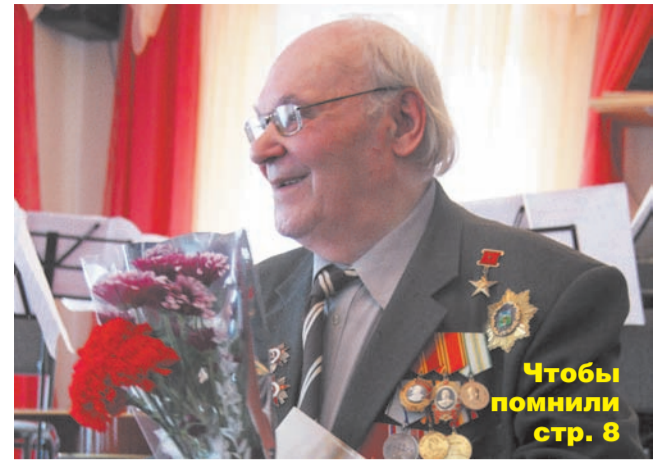
Чтобы помнили стр. 8