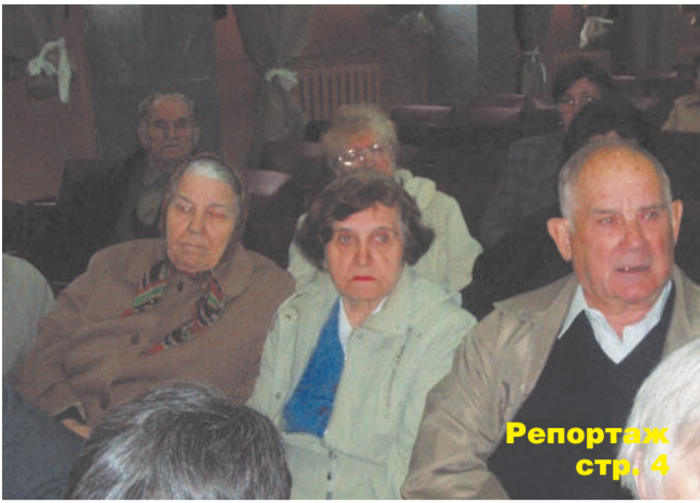
Репортаж стр. 4