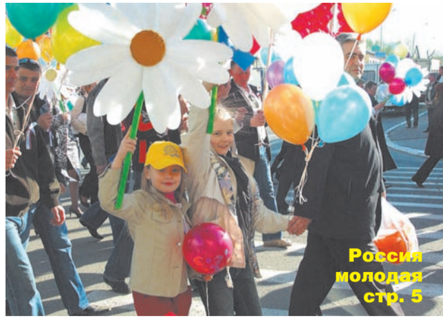
Россия молодая стр. 5