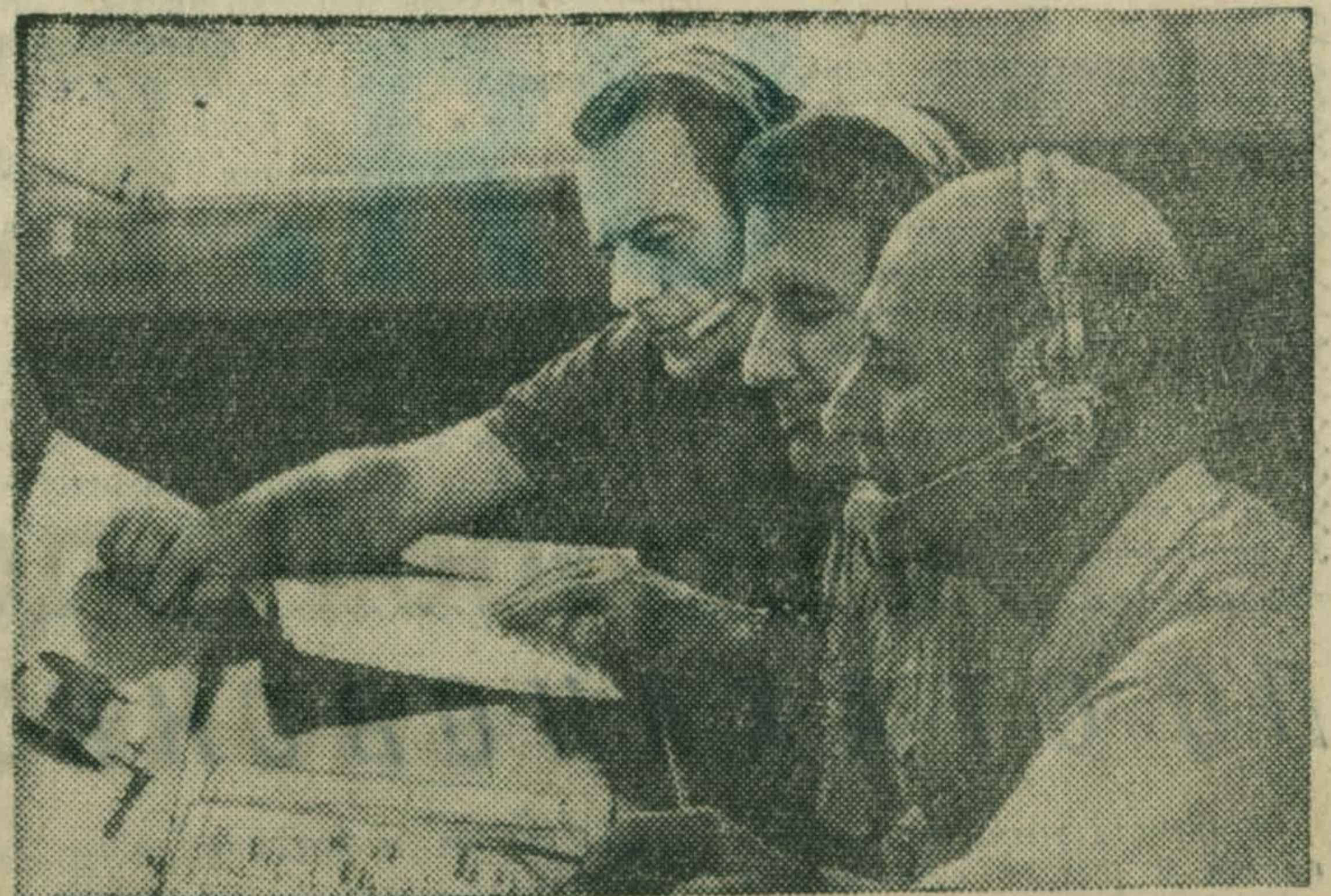
Американские астронавты, участвующие в совместной программе «Союз—Аполлон», — Дональд Слейтон, Вэнс Бранд и Томас Стаффорд (слева направо).

Важнейшей частью совместной программы «Союз — Аполлон» станет стыковка двух кораблей, запланированная на 17 июля над Европой. Во время совместного полета двух кораблей, который продлится двое суток, космонавты совершат четыре перехода из одного корабля в другой, проведут серию научных экспериментов.