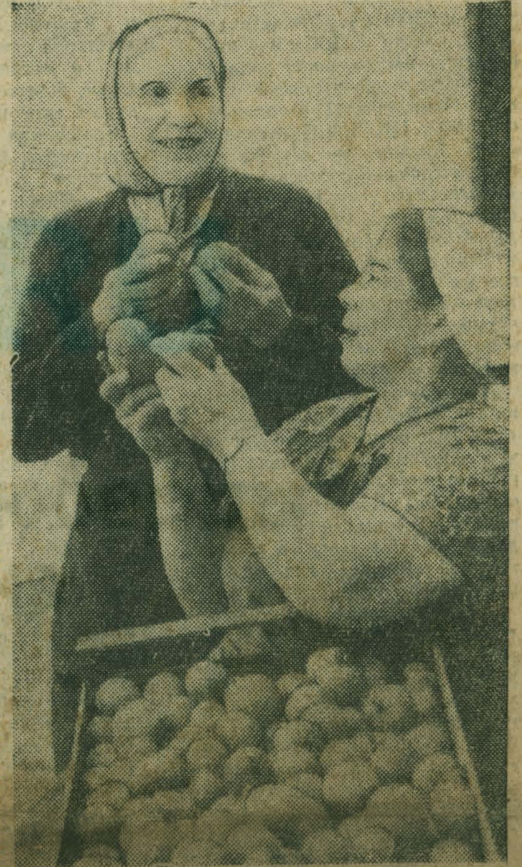
Успешно справившись с пятилетним планом сдачи овощей, растениеводы совхоза им. Моссовета соревнуются за досрочное выполнение годового плана. На склад реализации поступают огурцы и помидоры, морковь и свекла, капуста разных сортов, зеленные.