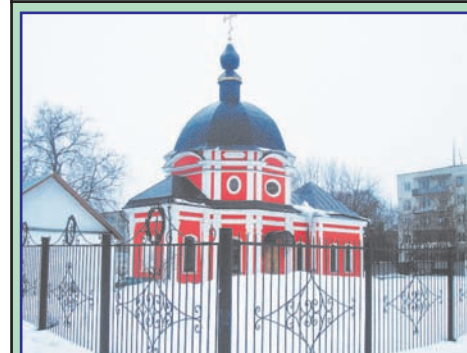
Церковь Преображения Господня

11 мая. 16.30 – вечерня и утренняя 12 мая. Отдание Пасхи. Девять мучеников Кизических. 8.30 – литургия 16.30 – всенощное бдение. 13 мая. Вознесение Господне. Ап. Иаков Зеведеев. 8.30 – литургия 14 мая. 16.30 – заупокойные вечерня, утренняя, лития 15 мая. Троицкая родительская суббота. Свт. Афанасий Великий. 8.30 – литургия 16.30 – всенощное бдение. 16 мая. Святые отцы Первого Вселенского Собора. 8 ч. – литургия 16.30 – молебен