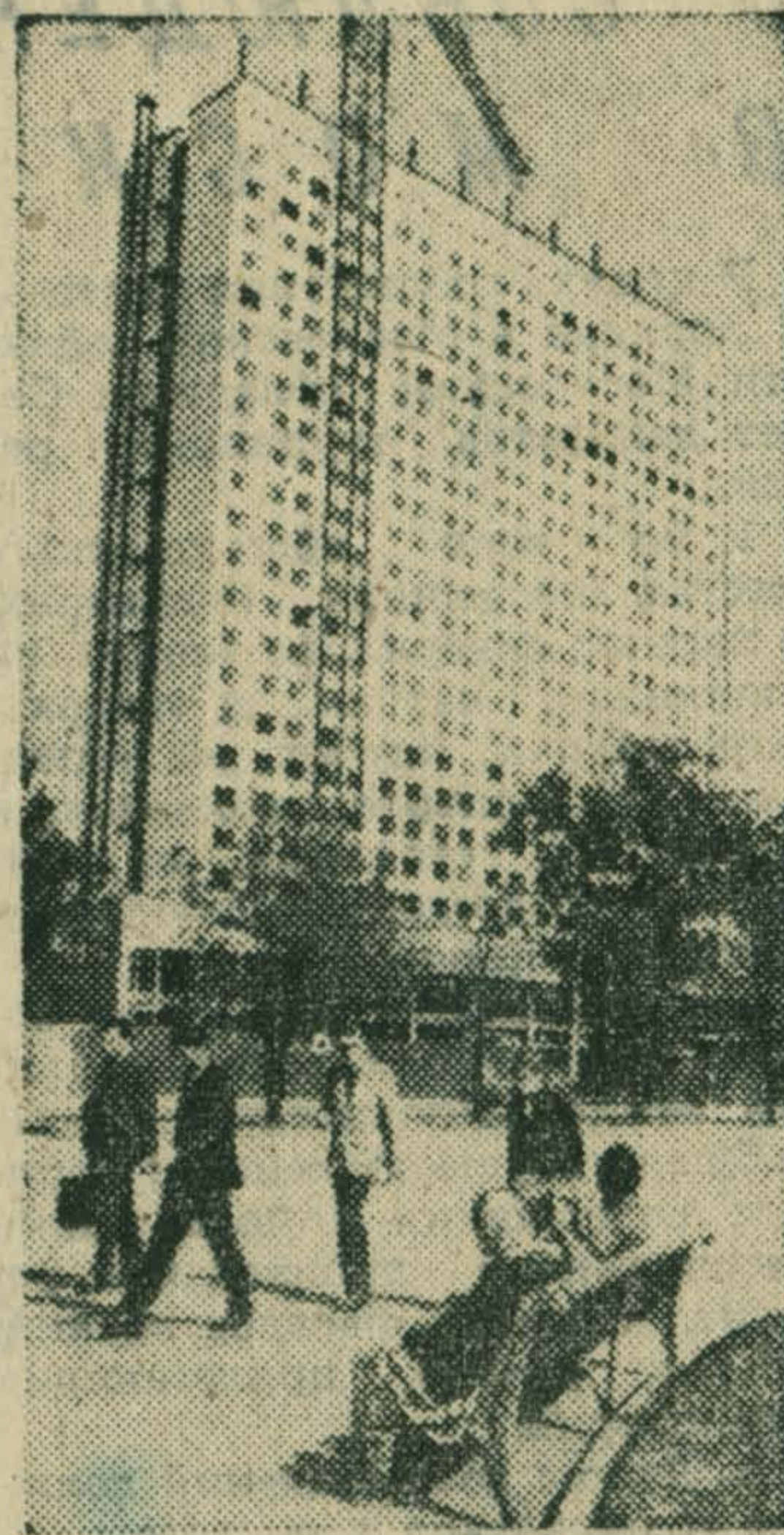
Новосибирск. На площади имени Гарина-Михайловского полным ходом идет строительство самого высокого в городе здания — 24-этажной гостиницы. В ее комфортабельных одно- и двухместных номерах смогут одновременно разместиться 1000 человек. НА СНИМКЕ: строительство гостиницы.