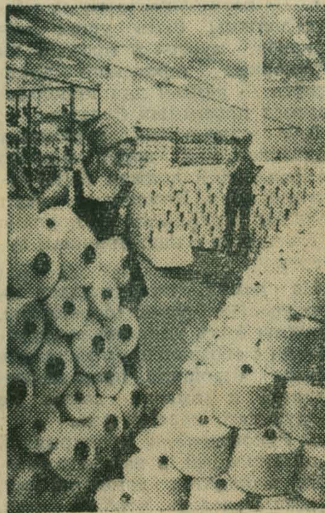
Далеко за пределами нашей страны известны алтайские ситцы. Нарядные ткани, выпускаемые Барнаульским хлопчатобумажным комбинатом, охотно покупают в США, Англии, Франции, Канаде, Монголии.

Принимая во внимание, что хозяйства района не все в равной мере располагают высококачественными семенными посадками районированных в Московской области сортов, важно заранее предусмотреть обмен семян между колхозами и совхозами района. Так колхоз им. Дзержинского и госплемзавод «Петровское» использовали на посадку в текущем году ряд сортов нерайонированных в нашей области. Поэтому только тщательный их анализ может позволить решить вопрос о целесообразности их дальнейшего использования. Вместе с тем такие хозяйства, как ОПХ «Коренево», совхоз им. Моссовета, колхоз