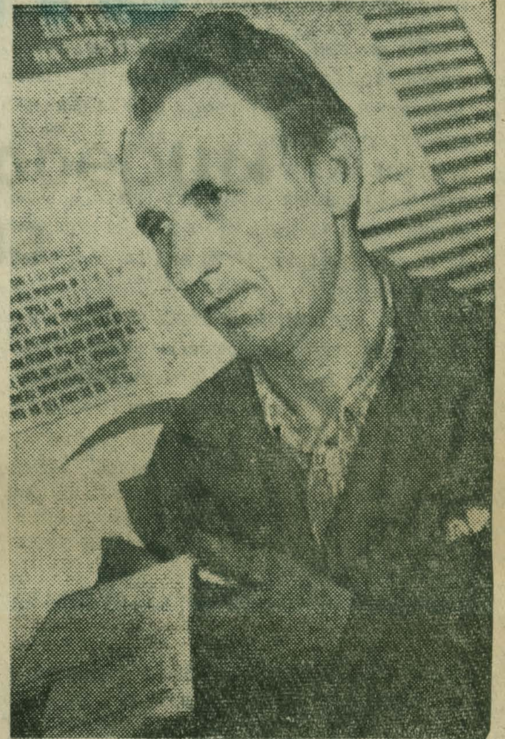
Стендовая постоянно рассказывает об успехах и проблемах социалистического соревнования в коллективе.