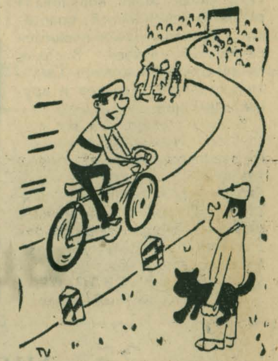
— Леша, пускай! Рис. В. Тюленева.

*** Студенту, прибывшему в колхоз на практику, выделили коня и телегу. Собираясь ехать в поле, он стал запрягать коня задком наперед. — Не так ты, сынок, запрягаешь, — заметил конюх. Тут подошел Киндзюлис и сказал: — А откуда вам известно, в какую сторону он поедет? (Из литовского юмора)