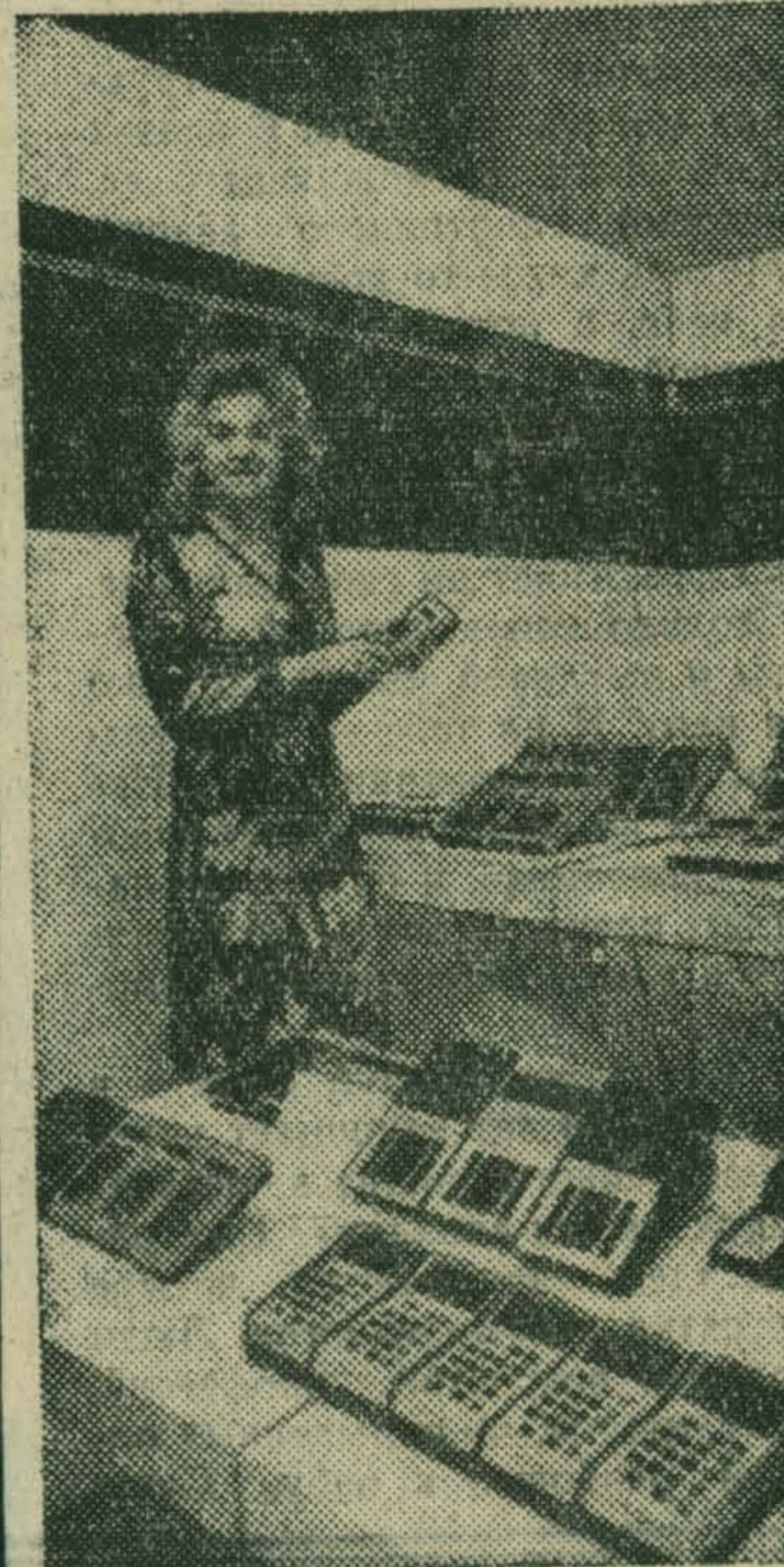
Москва. На территории выставочного комплекса «Сокольники» проводится международная отраслевая выставка «Средства механизации инженерно-технических и управленческих работ» — «Интерортехника-75».

НА СНИМКЕ: демонстрируются маленькие ЭВМ — клавишные вычислительные машины карманного типа «Электроника».