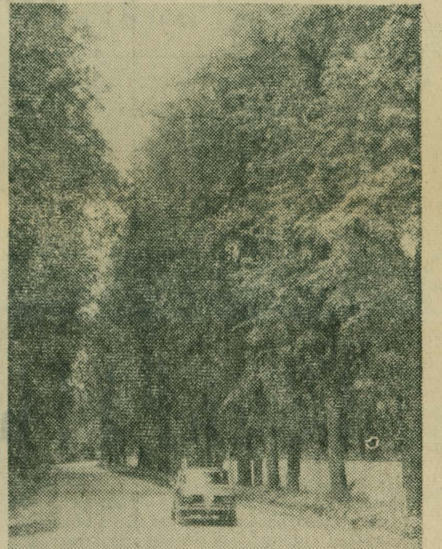
НА СНИМКЕ: лесная дорога в Зенино.

Л. ПЕТРУСЕВ, председатель ВООП госплемзавода «Петровское».