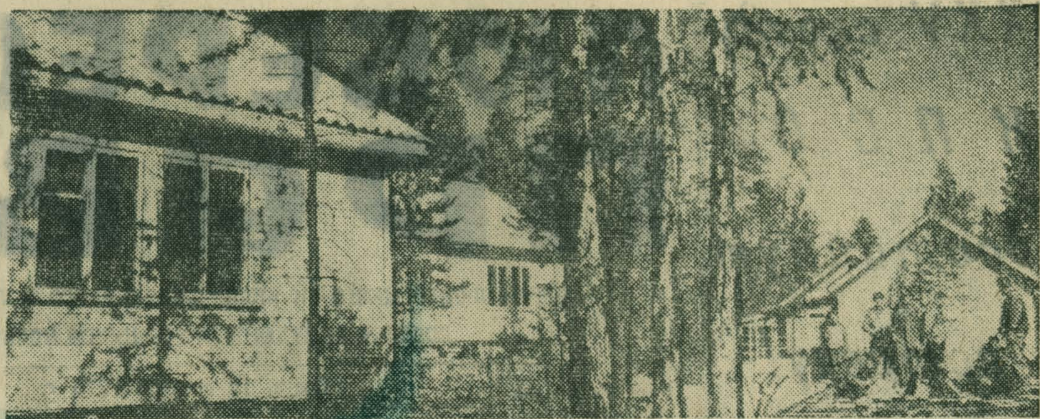
Иркутская область. На мысе Курлы на севере Байкала сооружается новый город Северо-Байкальск. Он будет расположен на трассе строящейся Байкало-Амурской магистрали. Северо-Байкальск быстро растет. Сегодня здесь живут две тысячи человек. На место палаток и вагончиков приходят удобные деревянные дома. НА СНИМКЕ: строится Северо-Байкальск.