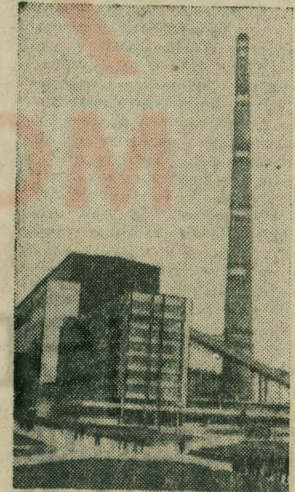
НА СНИМКЕ: Рязанская ГРЭС.

Успешно завершено строительство первой очереди Рязанской ГРЭС мощностью 1 миллион 200 тысяч киловатт и досрочно выполнены задания по выработке электрической энергии.