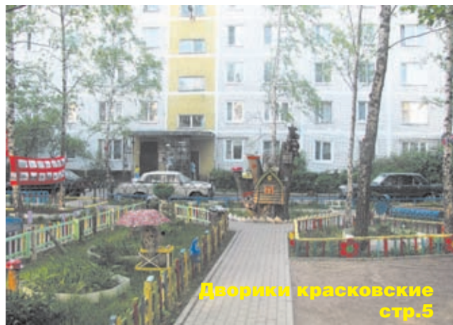
Дворики красковские стр.5