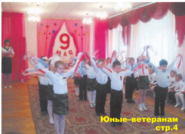
Юные ветеранам стр.4