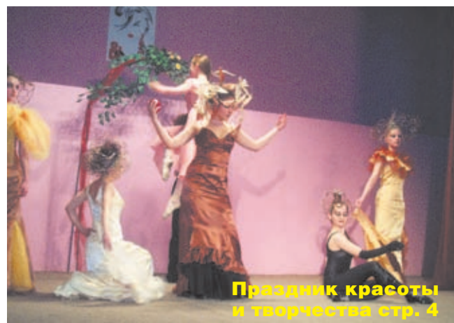
Праздник красоты и творчества стр. 4