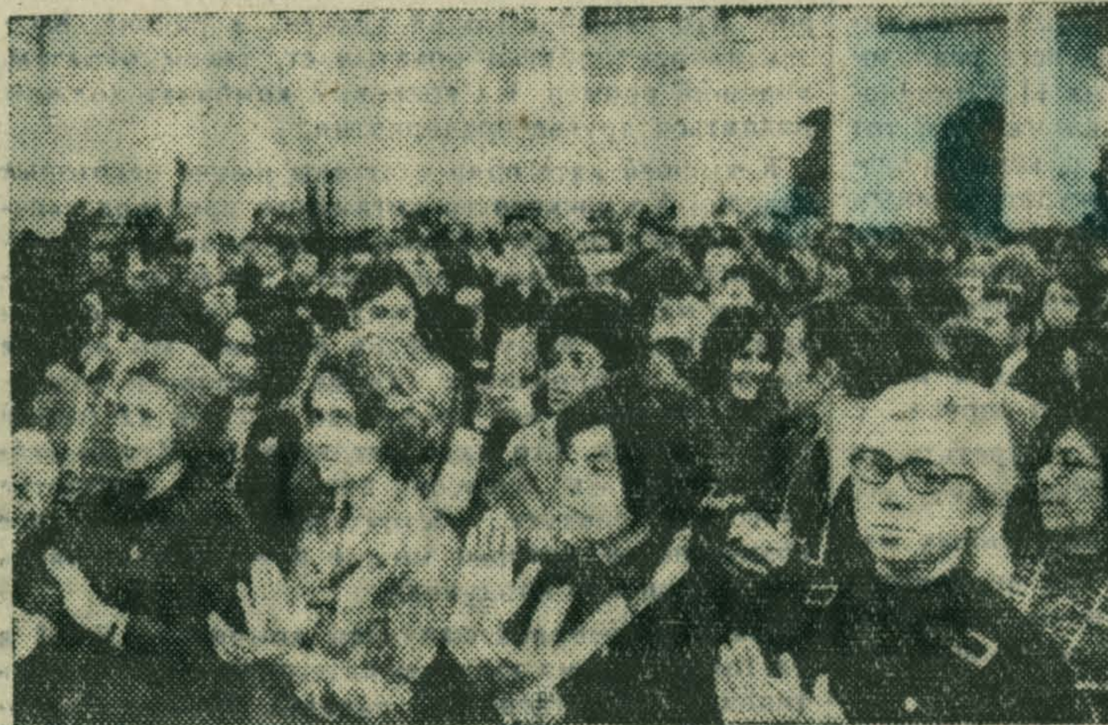
Москва. Участницы Всемирной встречи девушек в Колонном зале Дома Союзов.