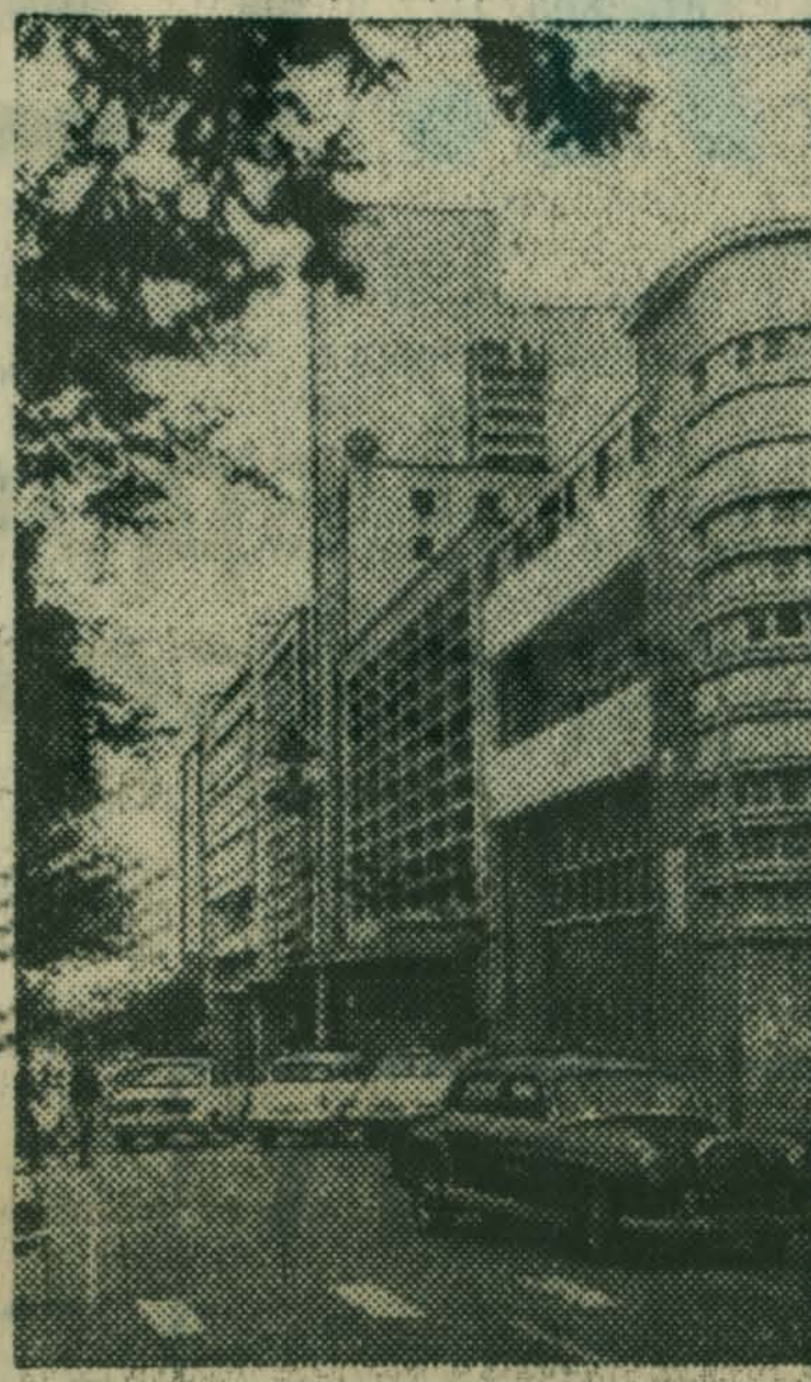
Столица Мозамбика Лоренсу-Маркиш — один из крупнейших портов африканского материка.