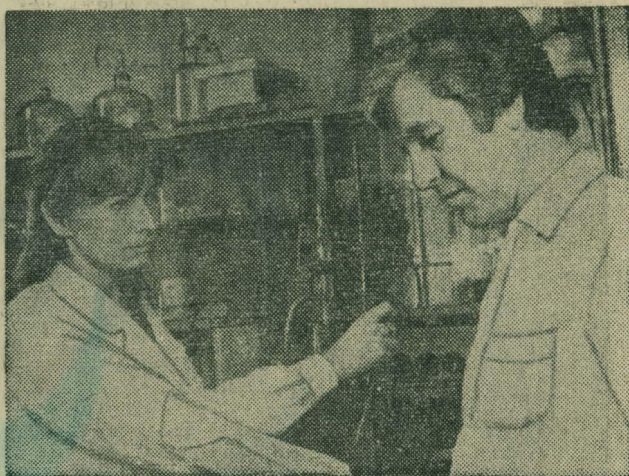
Электризуемость полиэфирных волокон — нежелательное явление. Возникновение зарядов статического электричества создает технологические и эксплуатационные трудности.

В Институте химической физики академии наук СССР совместно с Литовским институтом текстильной промышленности разработан способ понижения величины статического электричества путем специальной обработки ацетатного шелка.