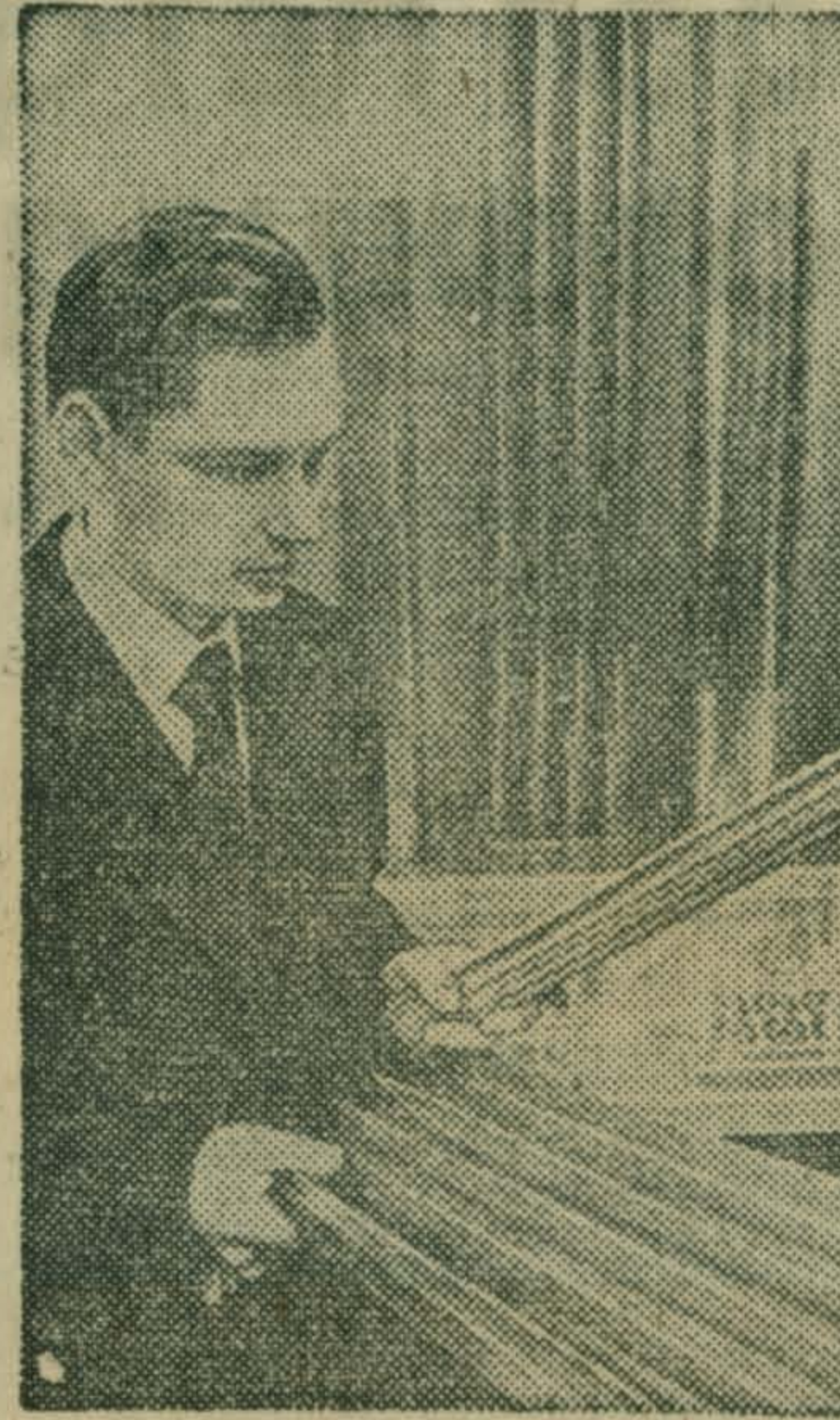
В Физико-техническом институте имени А. Ф. Иоффе АН СССР проводится исследование по получению профилированных изделий непосредственно из расплава без