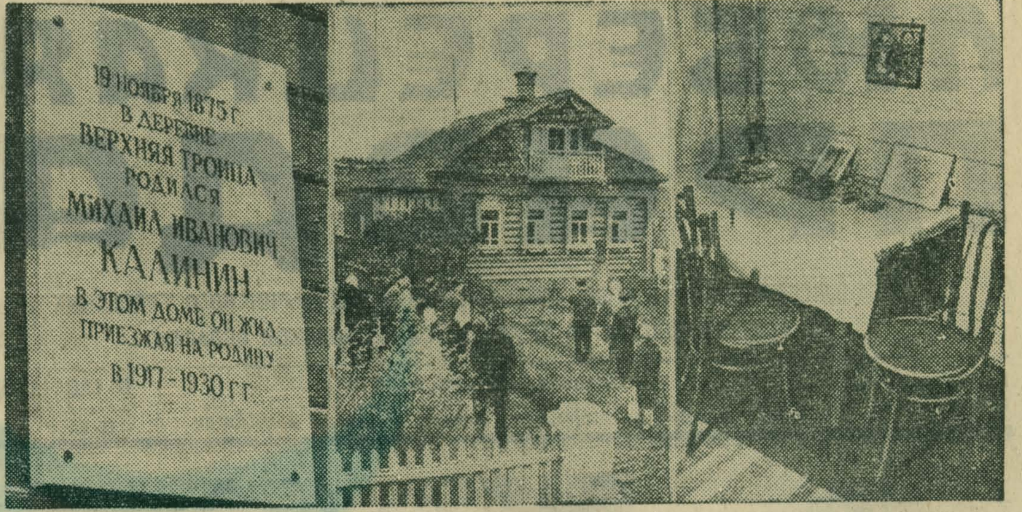
19 ноября исполняется 100 лет со дня рождения выдающегося деятеля Коммунистической партии и Советского государства М. И. Калинина (1875—1946). Вместе с В. И. Лениным он стоял у истоков создания Коммунистической партии, был корреспондентом ленинской «Искры», участником первой русской революции 1905—1907 годов. М. И. Калинин принимал активное участие в подготовке и проведении Великой Октябрьской социалистической революции. По рекомендации В. И. Ленина в марте 1919 года М. И.

Калинин был избран Председателем ВЦИКа, а с 1938 занимал пост Председателя Президиума Верховного Совета СССР. «Всесоюзный староста» — так любовно называли Калинина трудящиеся.