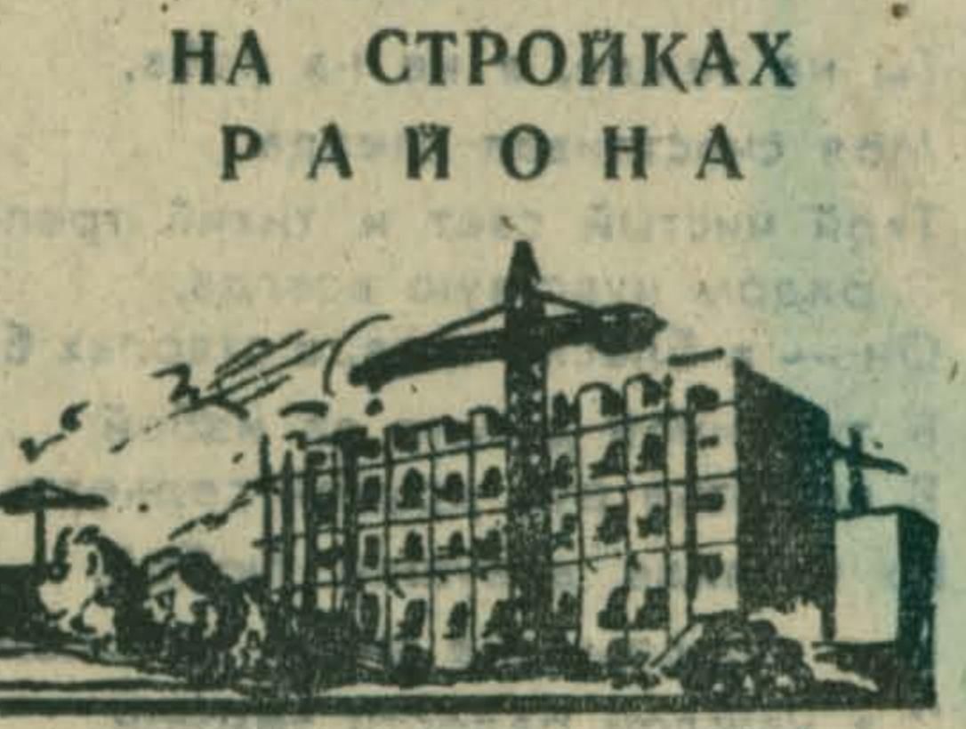
НА СТРОЙКАХ РАЙОНА

менчики бригады Д. С. Рыжикова. Изучив проект ЦК КПСС к XXV съезду партии, они приняли повышенные социалистические обязательства на пер-