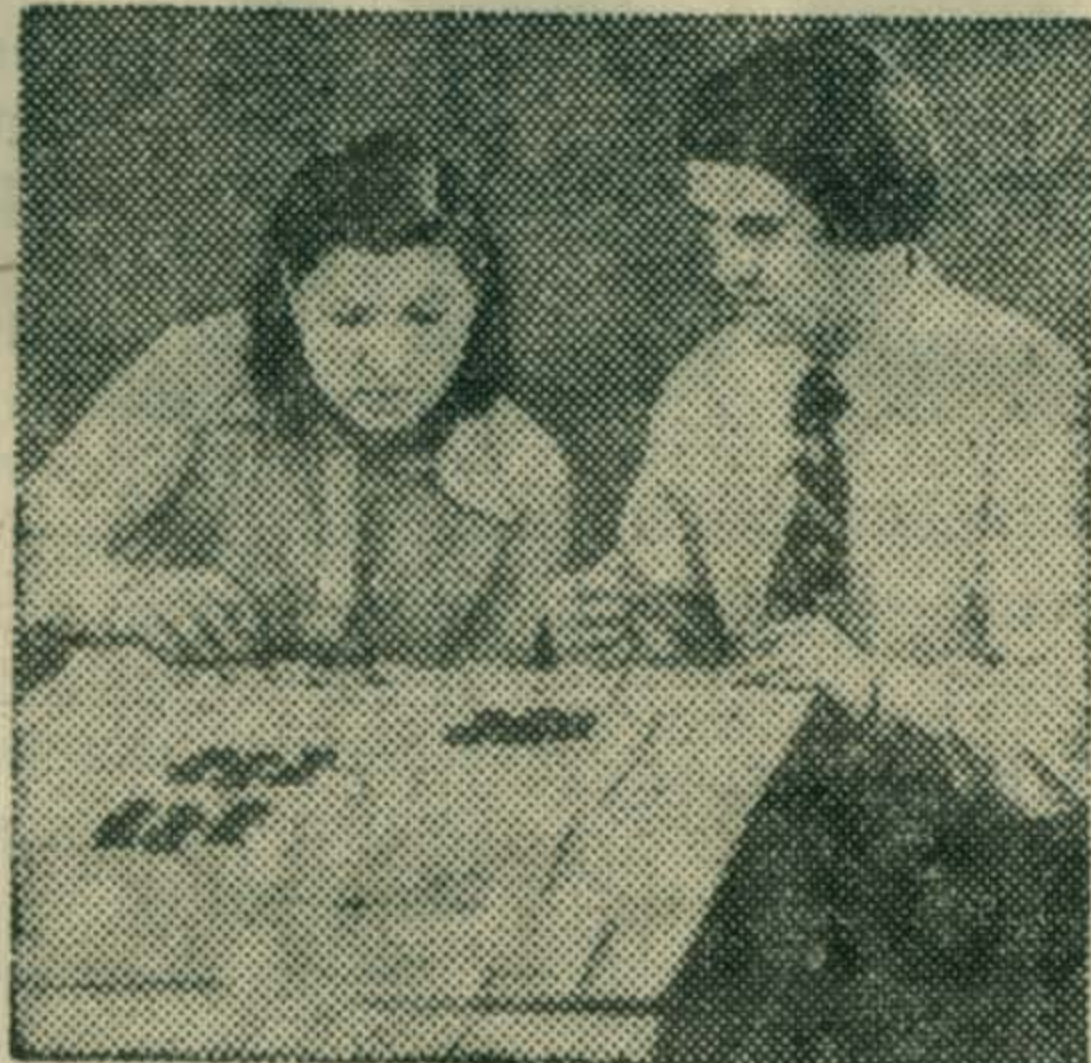
Фестиваль народного творчества