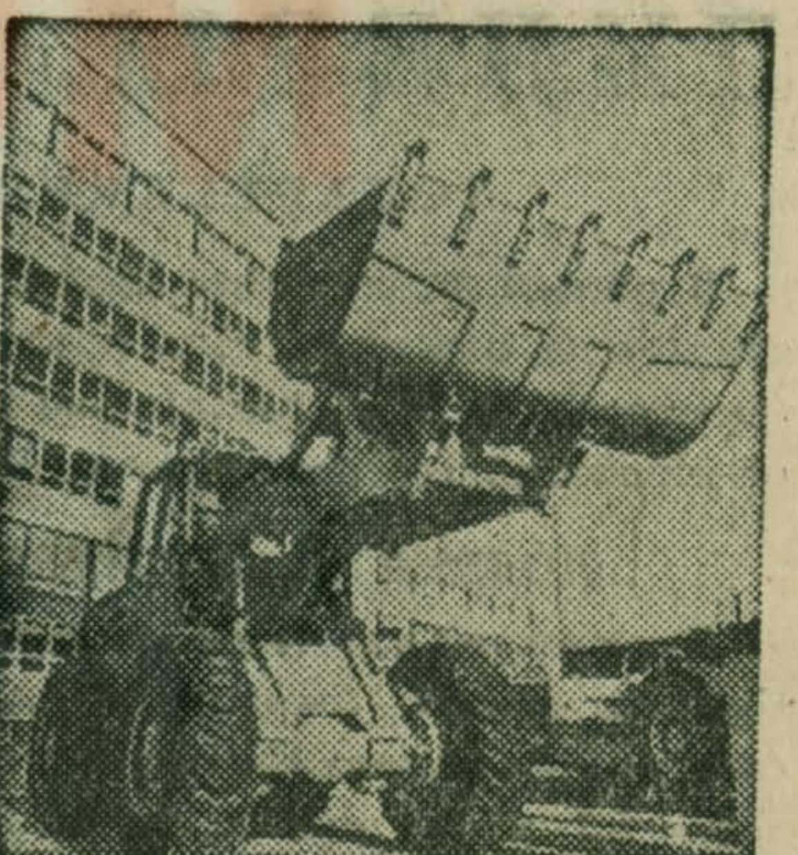
ПОЛЬША. Погрузчик для меднорудной промышленности, выпущенный заводом «Фадрома» во Вроцлаве. Десетки таких машин используются сейчас на медных рудниках страны.