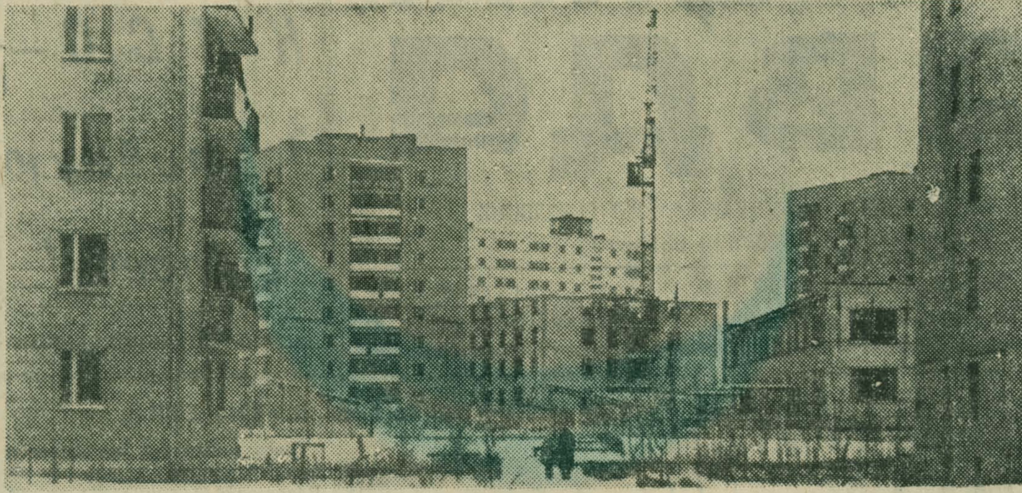
НА СНИМКЕ: квартал 3 «а» — один из микрорайонов города.

Осуществляя планы научно-технического прогресса и социального развития коллективов, больших перемен добились за годы минувшей пятилетки трудящиеся города Лыткарино, который отнесен недавно к категории городов областного подчинения. На этой странице и рассказывается о том, как живут лыткаринцы сегодня.