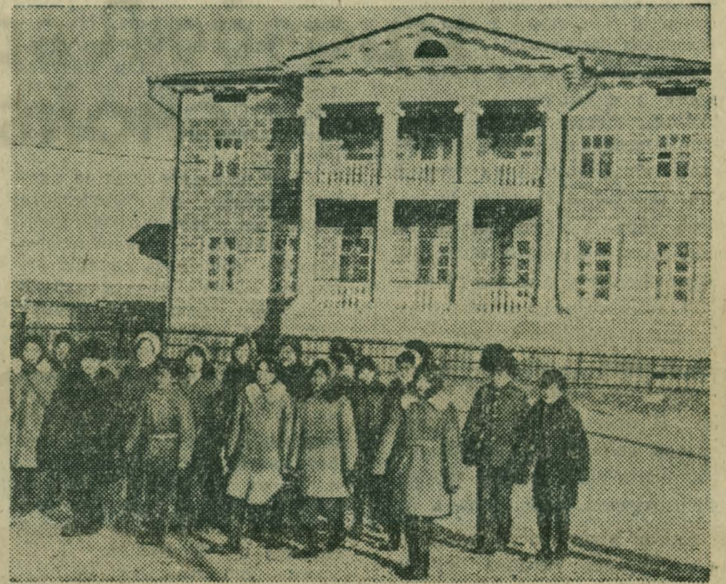
Бурятская АССР. В забайкальском селе Новоселенгинске открыт историко-мемориальный комплекс «Декабристы в Бурятии».

И. КОРНЕЕВ, мастер завода им. Ухтомского.