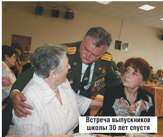
Встреча выпускников школы 30 лет спустя