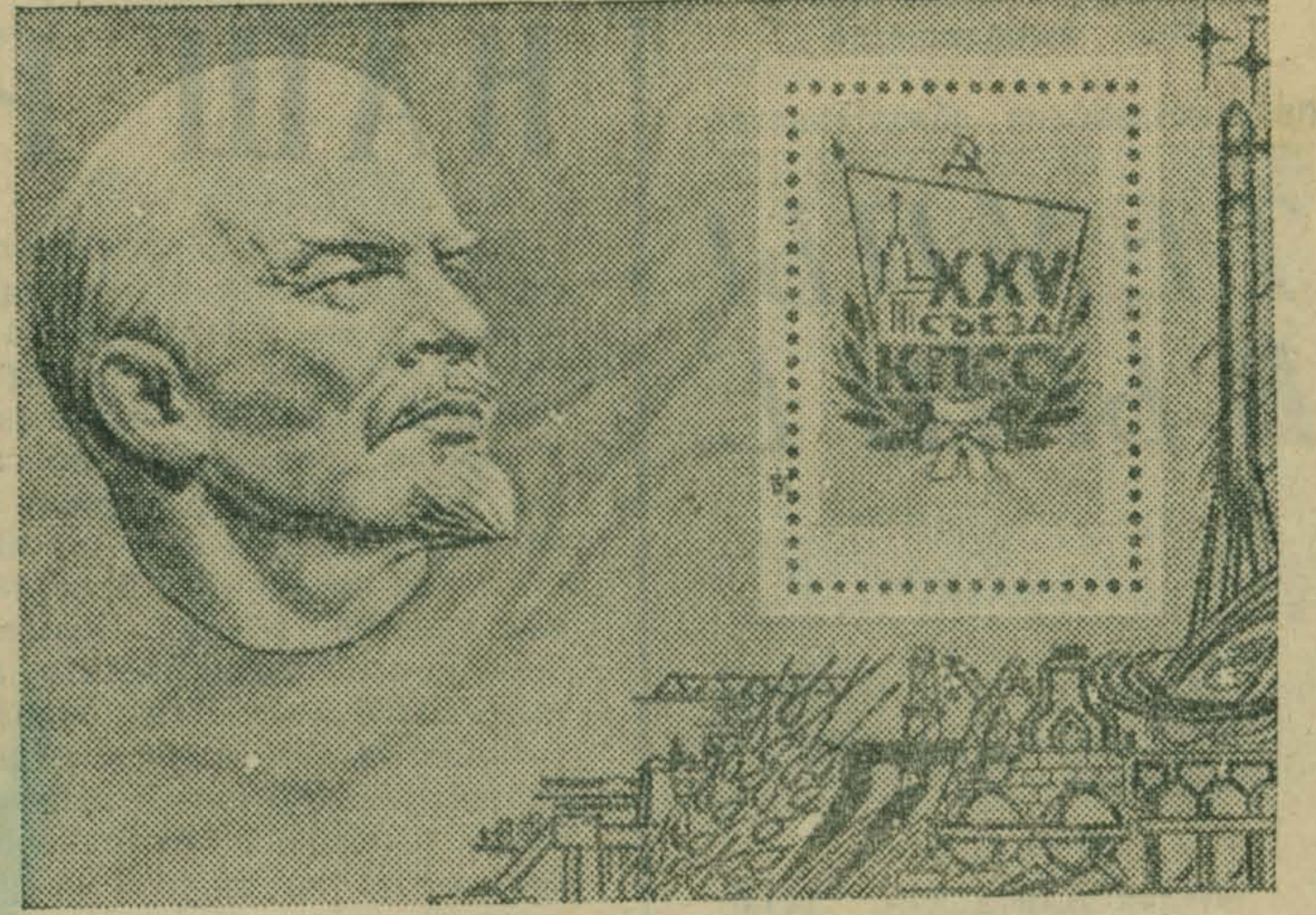
Министерство связи СССР выпустило почтовый блок, посвященный XXV съезду КПСС. НА СНИМКЕ: новый почтовый блок.

ПО ВЕРТИКАЛИ: 1. Проток. 2. Розинг. 3. Наказ. 5. Норте. 6. Пайда. 7. «Узник». 8. Аллит. 10. Кайса. 12. Ветеринар. 14. Финляндия. 16. Габал. 18. Уреке. 19. Свеча. 20. Нгами. 22. «Волга». 24. Силян. 26. Марат. 26. Крица. 28. Стенд. 29. Айран. 30. Теркин. 31. «Юбилей». 32. Ранет.