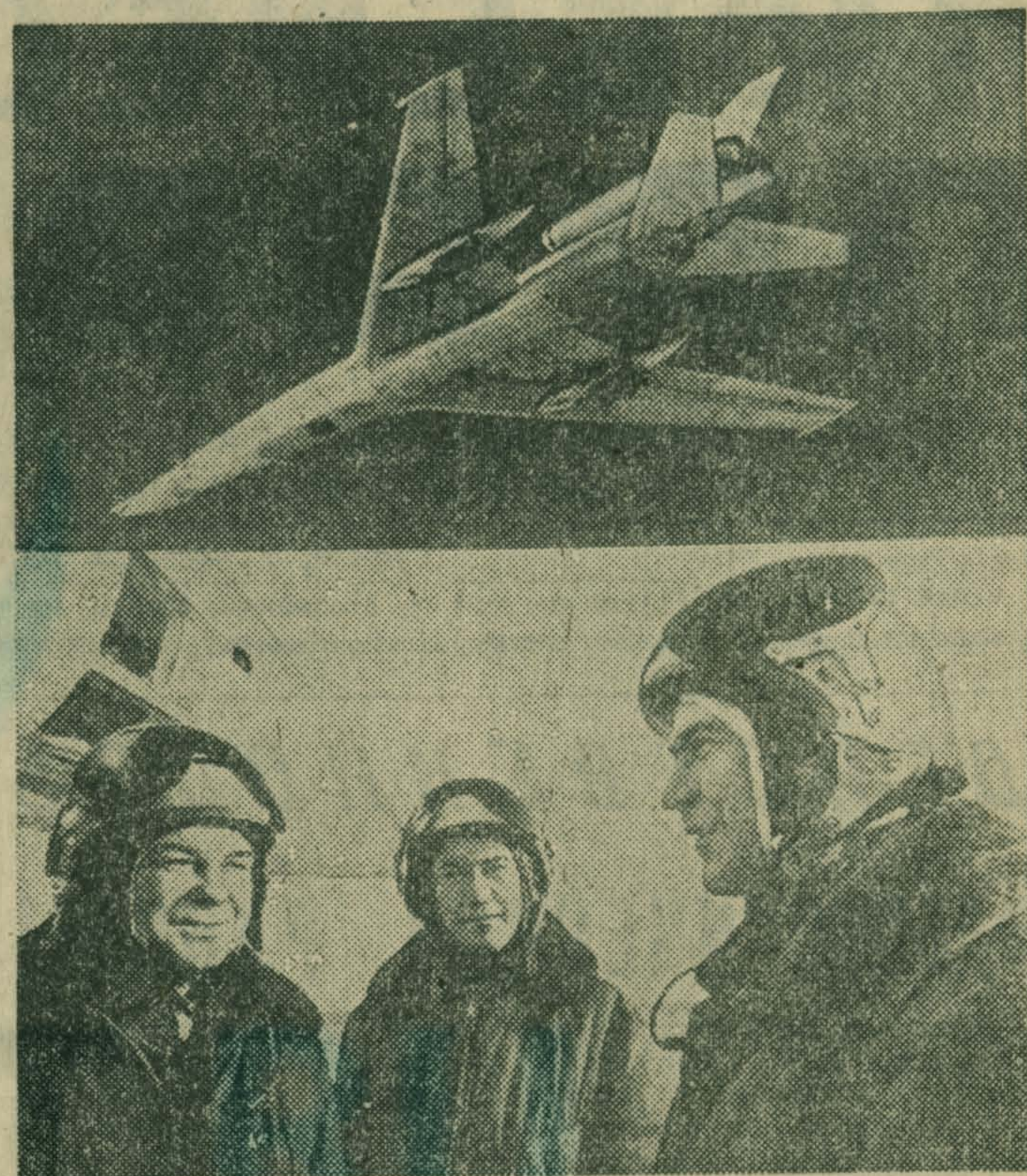
День и ночь несут боевую вахту в небе Родины авиаторы прославленных советских Военно-Воздушных Сил. Летчикам подвластна новейшая техника, которую вручила им страна.

Четыре года подряд носит звание отличной Н-ская гвардейская часть. В честь XXV съезда КПСС летчики и штурманы, инженеры и техники добиваются новых успехов в боевой и политической подготовке.