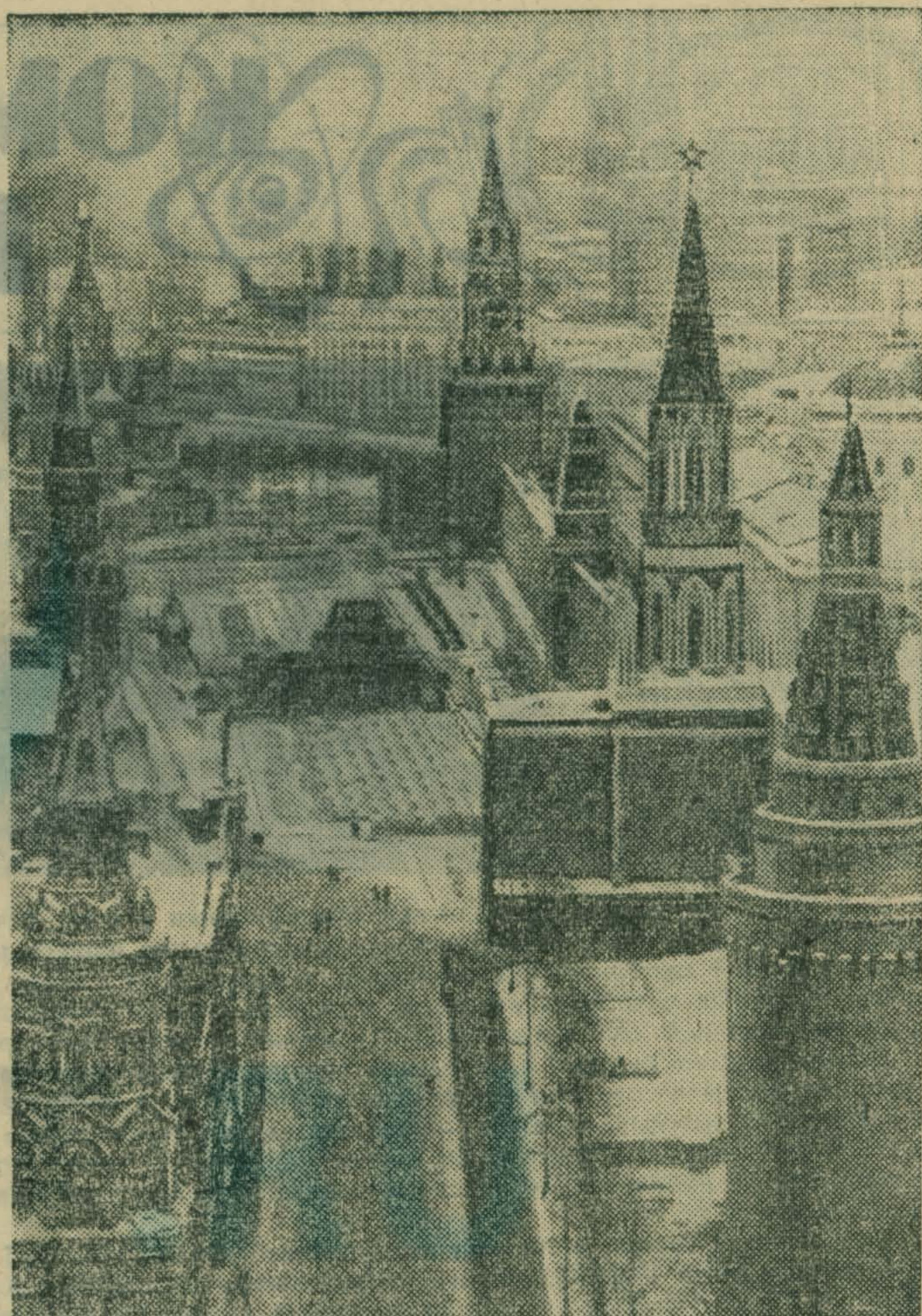
Москва, Красная площадь.