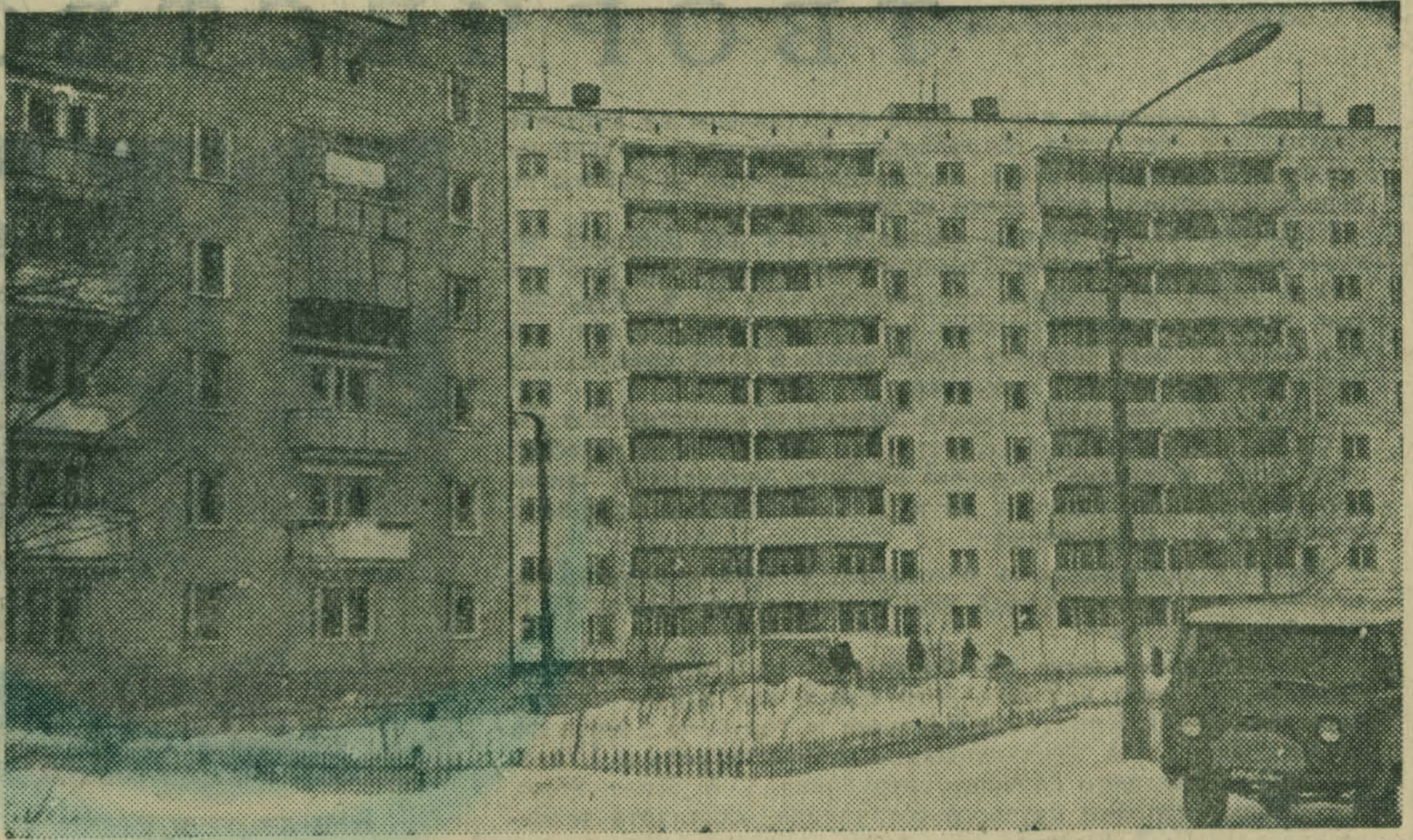
Неузнаваемо изменились за последние годы Люберцы. Все меньше и меньше становится малоэтажных устаревших строений. Зато стремительно возносятся современные дома, целые кварталы. Контуры девяти — двенадцати и даже четырнадцатизэтажных корпусов — вполне привычное явление для люберчан.

НА СНИМКЕ: новые дома в Панковском проезде Люберец.