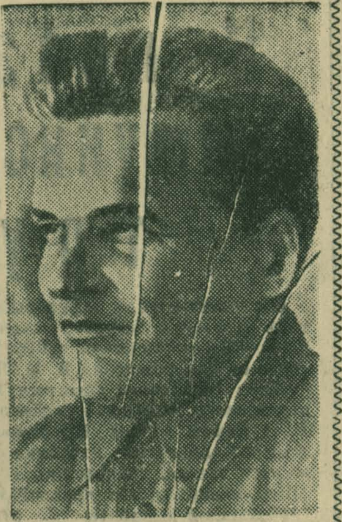
НА СНИМКЕ: С. М. Киров.

Сегодня исполняется 90 лет со дня рождения выдающегося деятеля Коммунистической партии и Советского государства, пламенного трибуна революции Сергея Мироновича Кирова (1886—1934). Три десятилетия посвятил он борьбе за дело ленинской партии. В дооктябрьские годы Киров создавал нелегальные типографии, укреплял партийные группы, вел пропагандистскую работу. Делегат II Всероссийского съезда Советов, С. М. Киров принимал непосредственное участие в Октябрьском вооруженном восстании в Петрограде. Сергеем Мироновичем Кирову, обладавшему огромным организаторским талантом партийного руководителя, умением поднять массы на боевые и трудовые подвиги, партия доверяет после победы Октября ответственнейшие поручения. В 1921—1925 годах Киров, секретарь ЦК Компартии Азербайджана, много сил отдал восстановлению нефтяной промышленности республики. Девять лет Киров возглавлял ленинградскую партийную организацию. С его именем связан расцвет индустриального Ленинграда, замечательные успехи строительства социализма в годы первых пятилеток. Инициатива и энергия С. М. Кирова сыграли исключительную роль в осуществлении социалистических преобразований всего северозападного края.