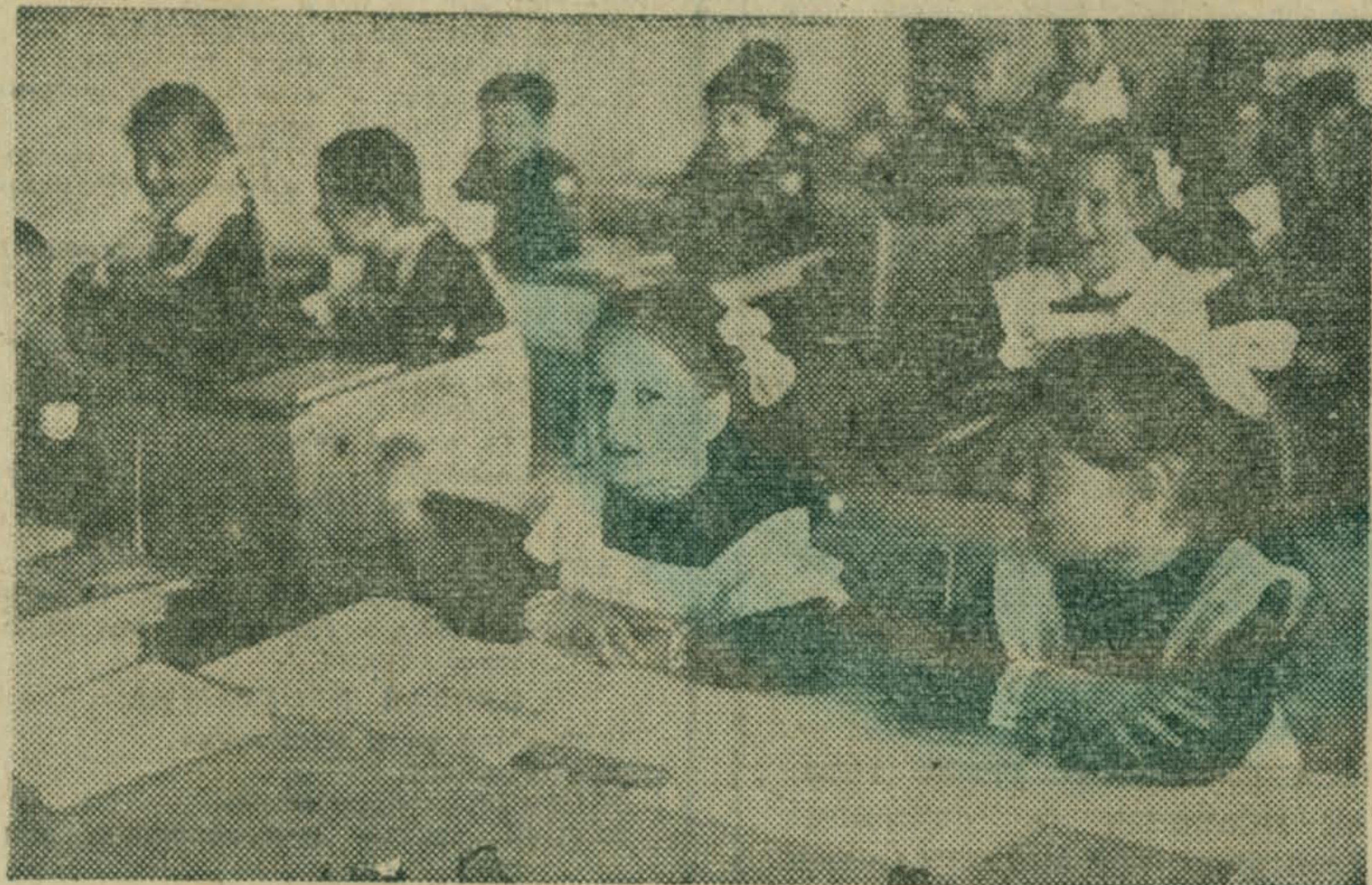
При виде счастливой звонкогласной детворы вспоминаешь и свое детство: одноэтажную, но казавшуюся тогда такой большой школу, седую добрую учительницу, друзей...

С. ГАЛИЕВ, редактор районной газеты «Знамя ленинизма» (Пос. Раевский, БАССР).