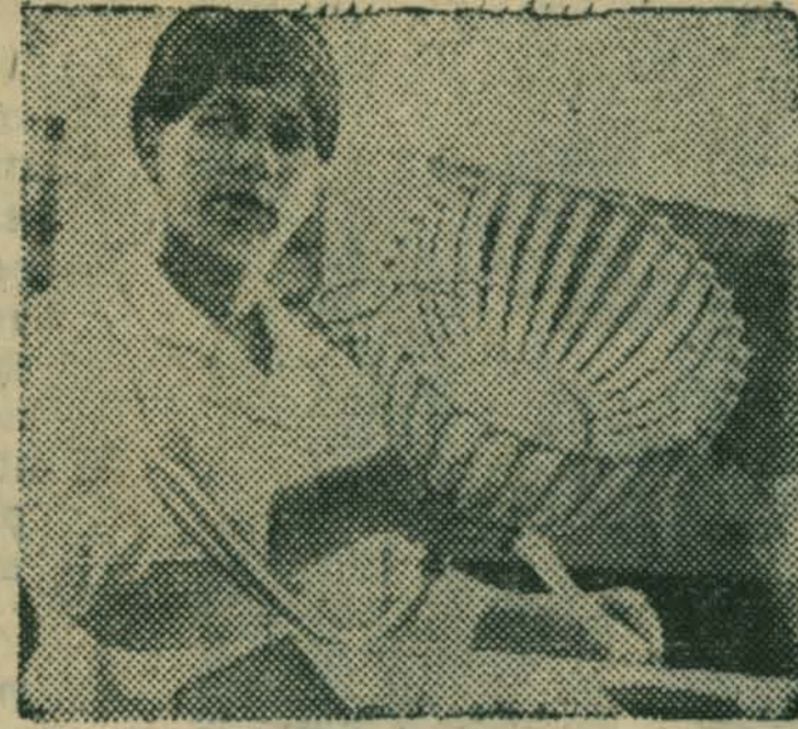
Электронные, оптические, лазерные устройства применяются в приборах, помогающих медикам