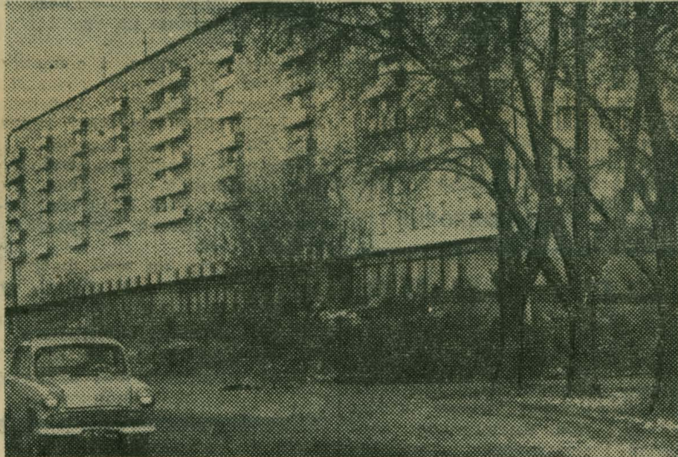
Растут новые дома в совхозе им. Моссовета.