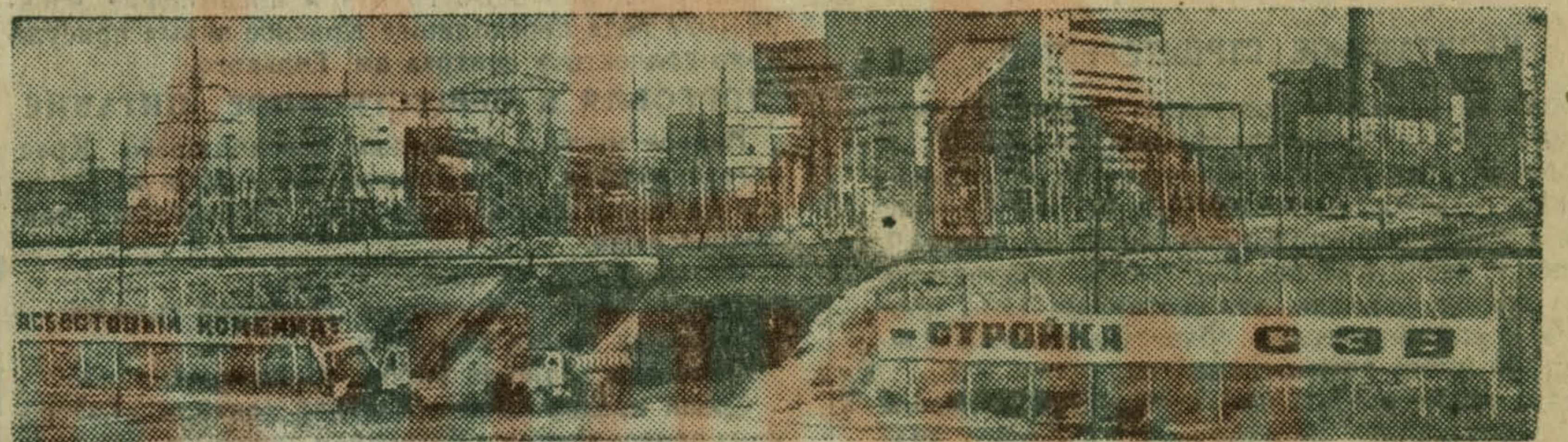
КИЕМБАЙ — СТРОЙКА СЭВ

В соответствии с комплексной программой дальнейшего углубленного развития социалистической экономической интеграции стран-членов СЭВ в Оренбургской области строится Кiemбаевский асбестовый горно-обогатительный комбинат. Сооружать его помогают братские социалистические