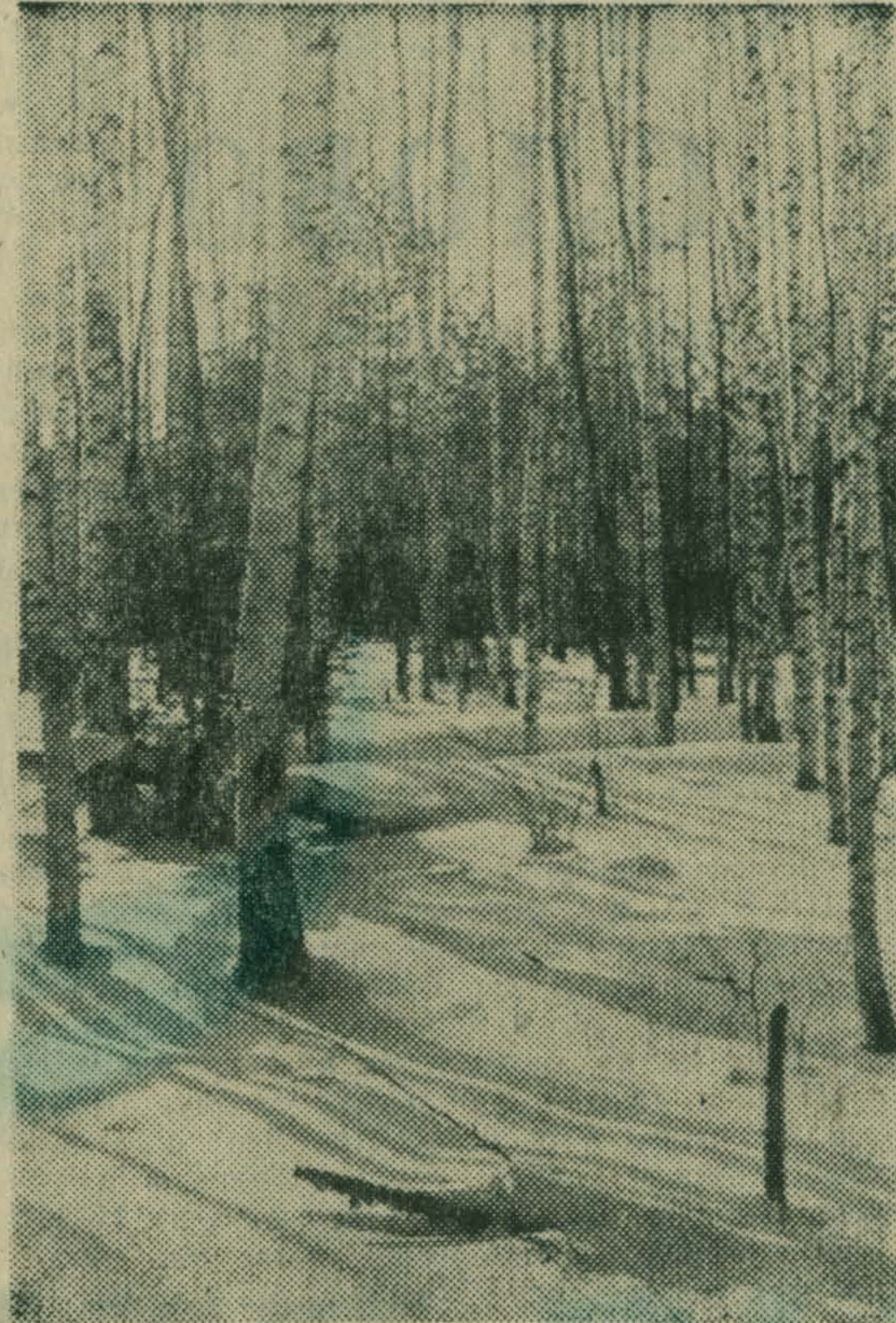
Веселый день. Сиреневые тени Ложатся на февральский снег. В снегу березы кутают колени И тихо дремлют в грезах о весне.