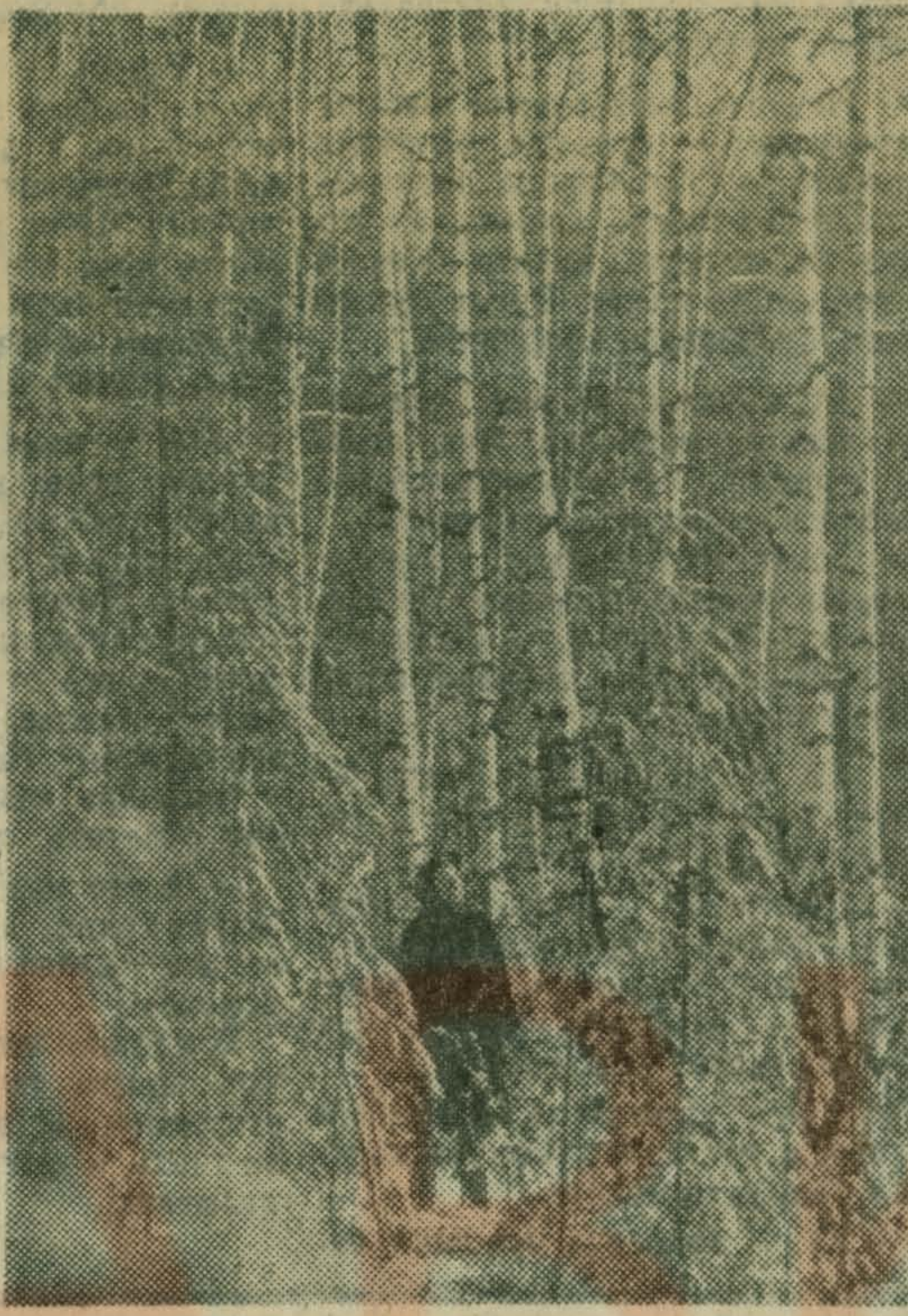
Еще февраль метелями поет, И тоненькая ель под ветром клонится, А март спешит, и весело встает Ему навстречу радостное солнце. Фото Г. ДИАКОНОВА. Текст Г. ГРЕБЕННИКОВА.