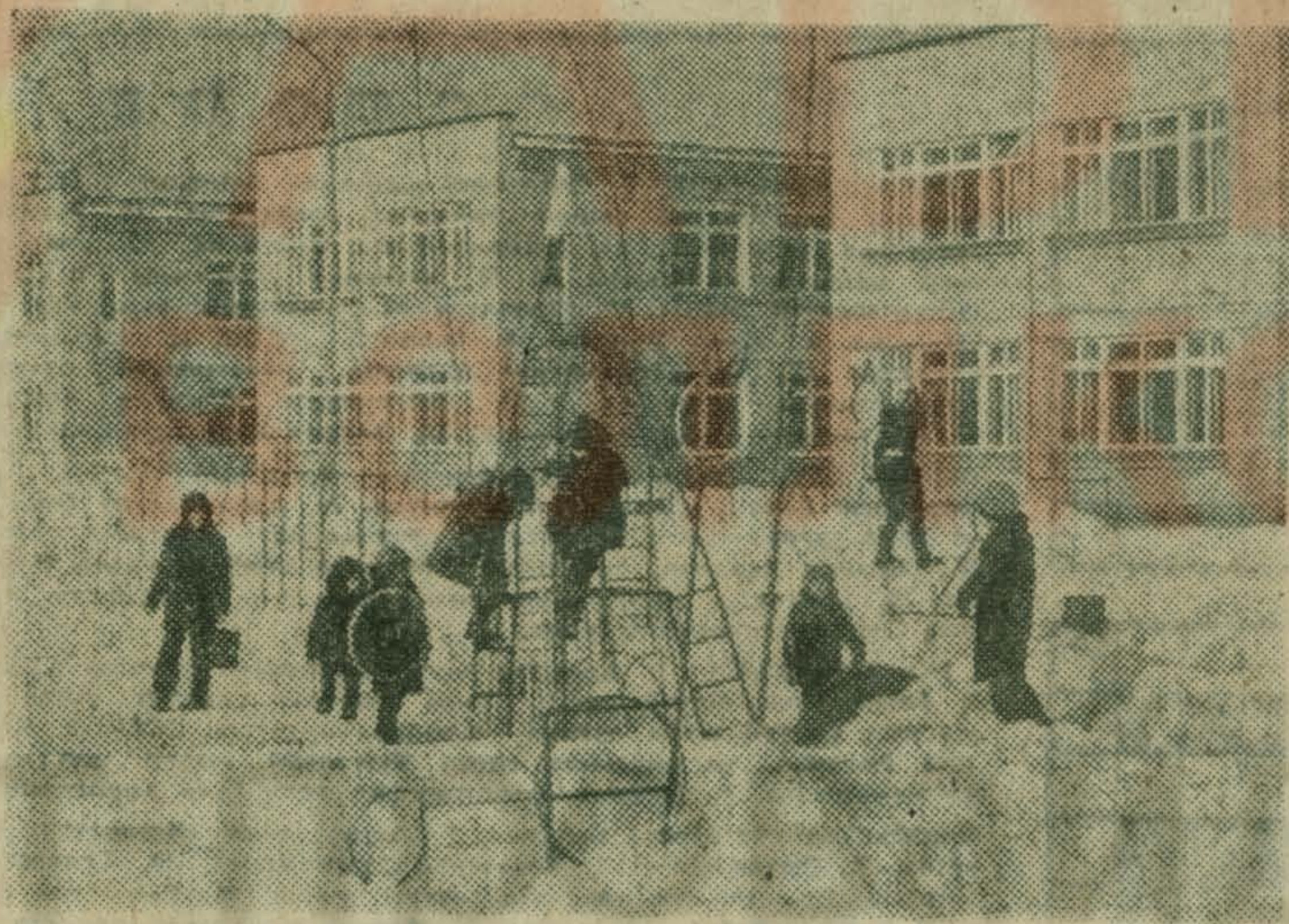
«Колосок» — новый детский комбинат, появился в четвертом микрорайоне Люберец летом прошлого года. И его непоседливые хозяева — дети рабочих и служащих завода им. Ухтомского — успели привыкнуть к нему, как к родному дому. Весело резвятся они на игровой площадке детского сада, растут здоровыми и жизнерадостными.