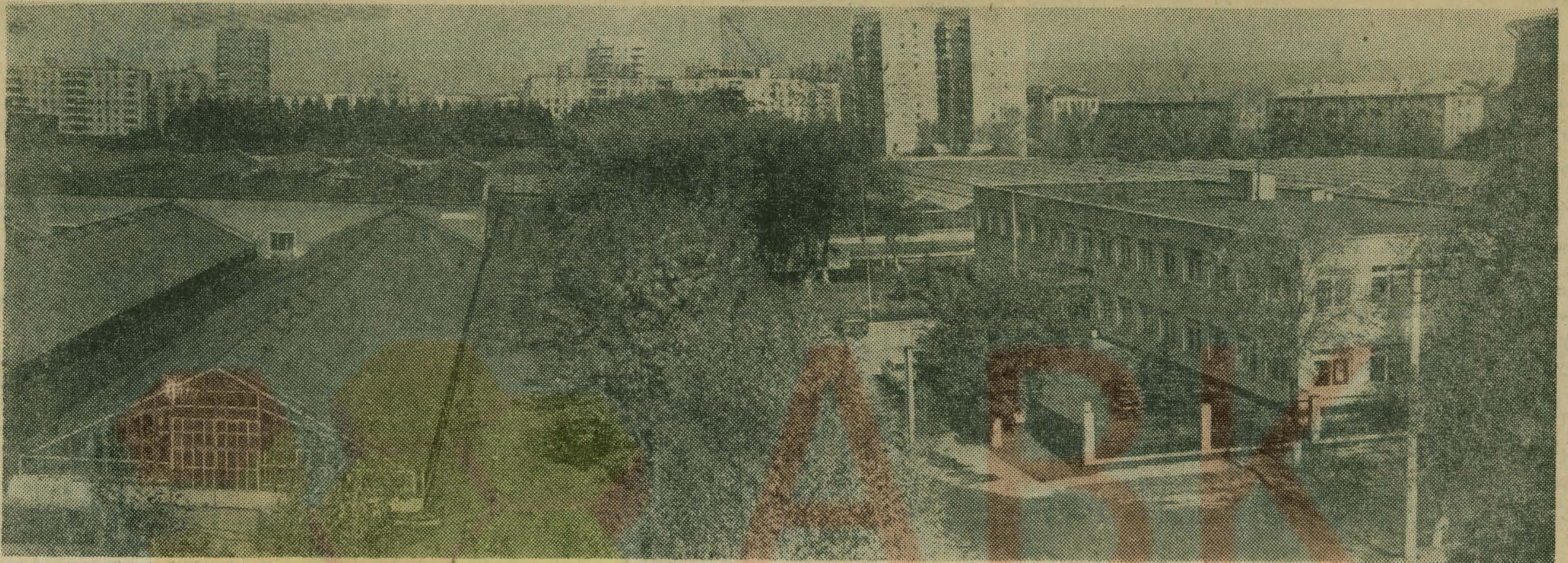
ПРОФЕССИОНАЛЬНО-ТЕХНИЧЕСКОЕ УЧИЛИЩЕ № 165 НА ПЕРЕДНЕМ ПЛАНЕ (СПРАВА) — УЧЕБНЫЙ КОРПУС.