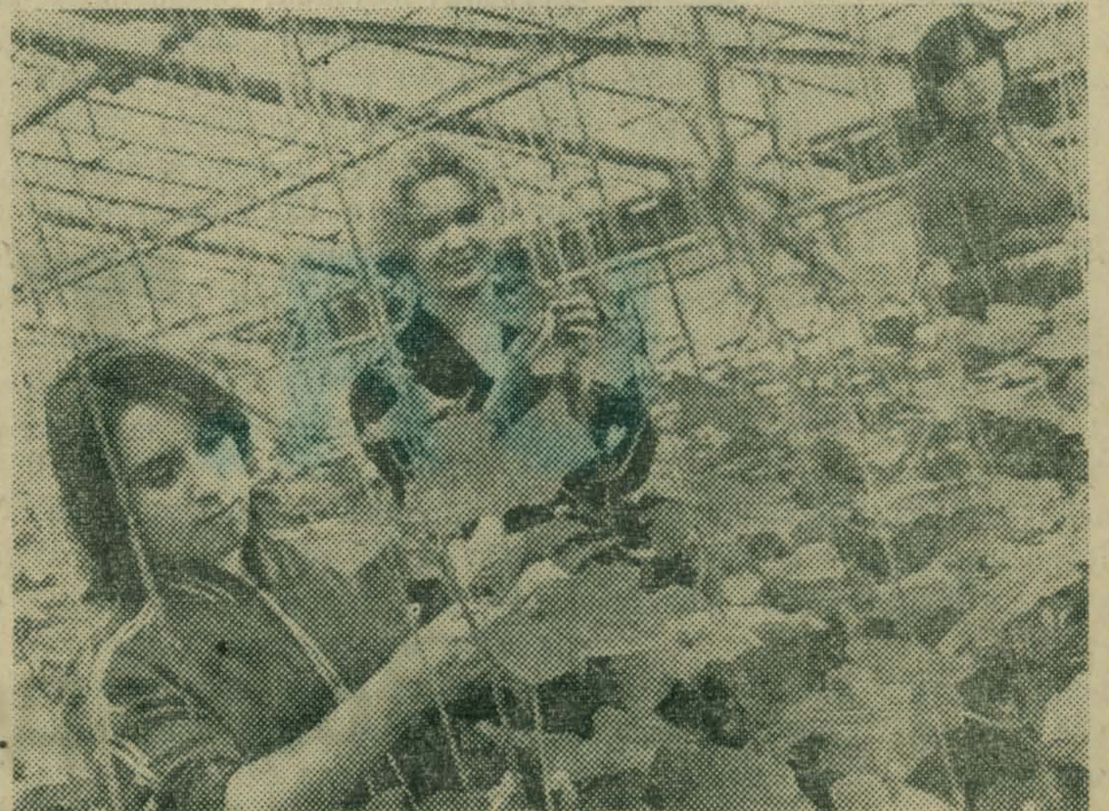
Училище, расположенное на территории совхоза «Марфино», имеет свою учебно-производственную базу. Здесь учащиеся получают навыки работы в теплицах.

АДРЕС УЧИЛИЩА: 127427. Москва, Кашеннин луг, дом № 4, телефоны 218-16-77, 218-40-95.