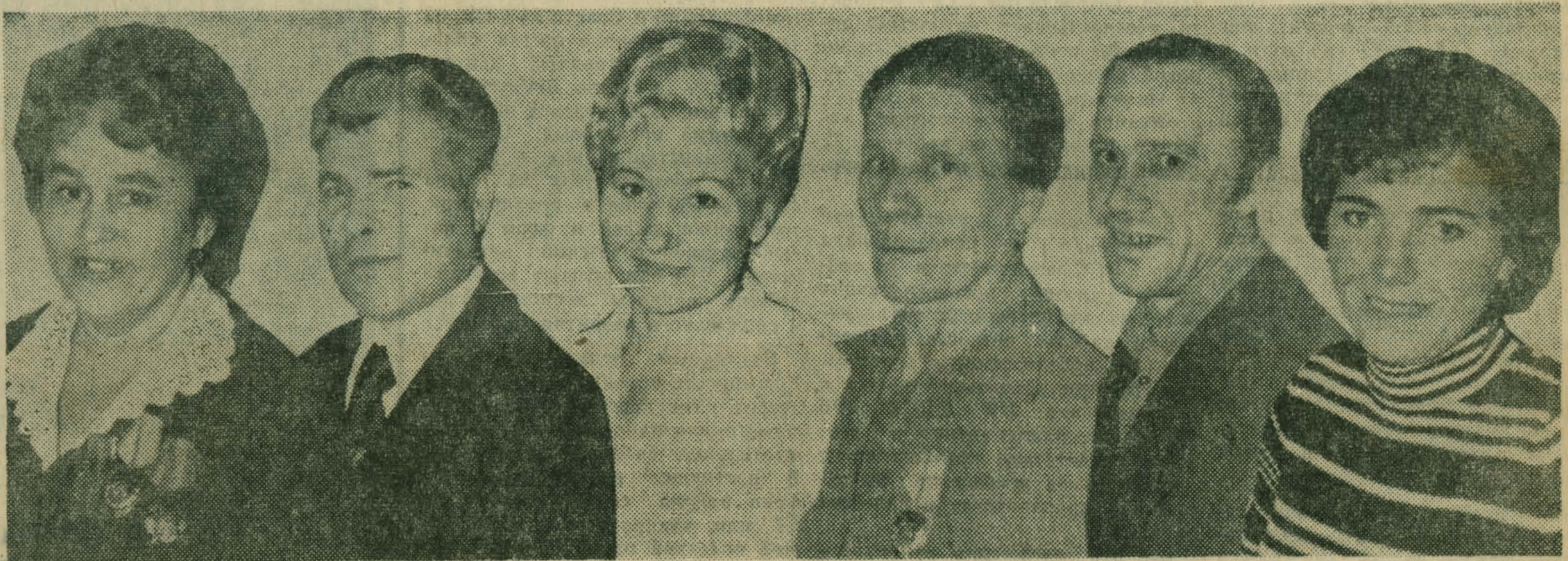
Осуществляя великое право на труд, предоставленное Конституцией СССР, советские люди вносят большой вклад в создание материально-технической базы коммунизма. В нашей стране созданы все условия для проявления инициативы в работе, способностей, талантов, которых в народе, как отмечал тов. В. И. Ленин, «непечотый родник».