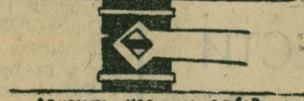
Вскрыть кран на отводе к газовым приборам.