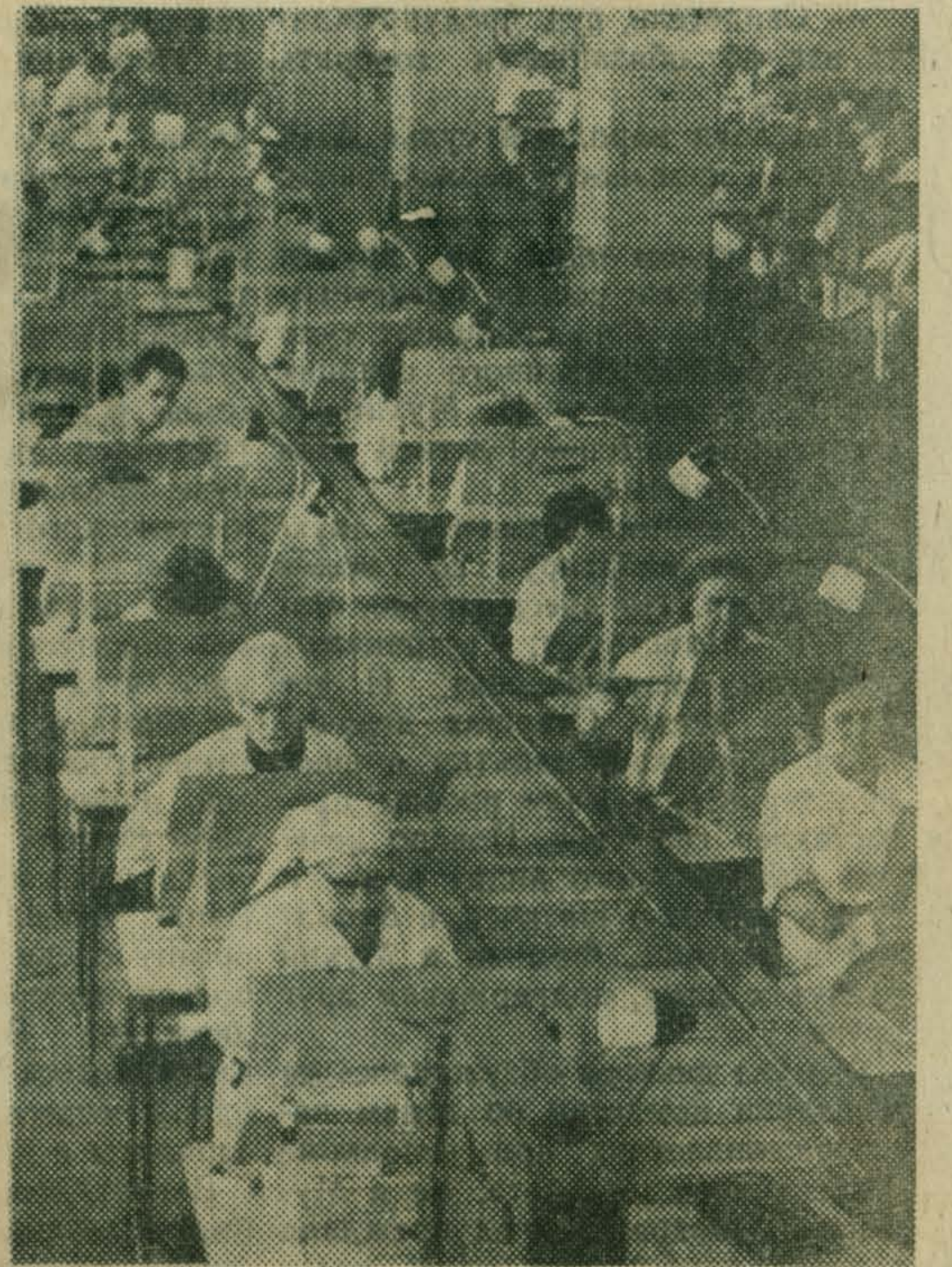
НА СНИМКЕ: в монтажном цехе учебно-производственного предприятия ВОС, где действует автоматизированная поточная линия для сборки узлов телевизоров.