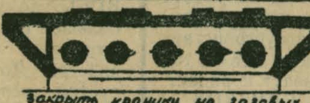
Вскрыть кранчики на газовых приборах.