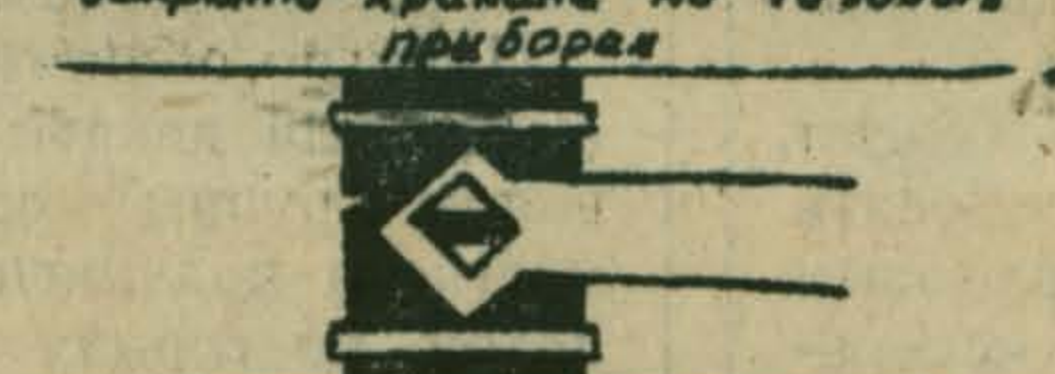
Закрывать кран на отводе к газовым приборам.