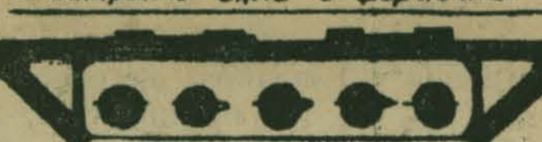
Закрывать краны на газовых приборах.