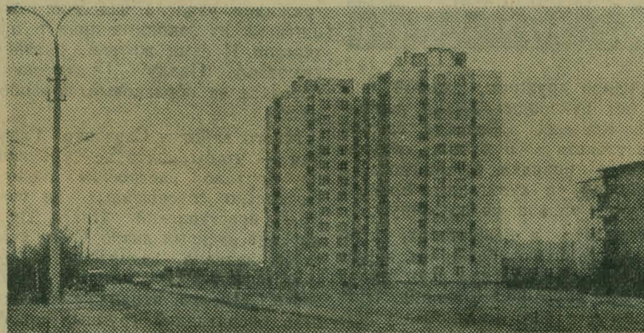
Еще не так давно здесь был пустырь, поросший бурьяном. Теперь он превратился в хорошо спланированный жилой массив, известный люберецчанам под названием 115-й квартал. Его дворы еще не украшают развесистыми кронами березы и клены, но саженцы уже пустили в землю крепкие корни. Быть зеленым и этому молодому микрорайону.