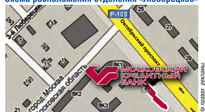
Схема расположения отделения «Люберецкое»

Адрес отделения МОСКОВСКОГО КРЕДИТНОГО БАНКА в г. Люберцы: Октябрьский пр-т, д. 10, корп. 1 Тел.: (498) 720-1402, (498) 720-1403 Справочная служба Банка: 8-800-100-4-888 Сайт www.mkb.ru