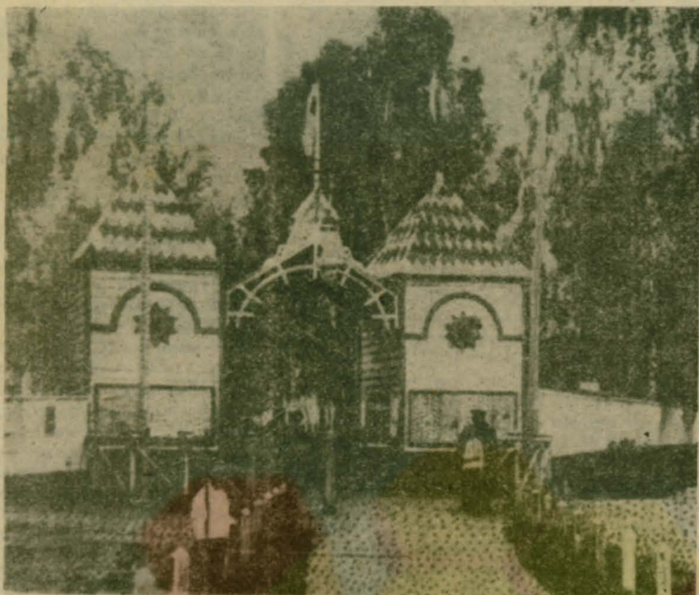
А таким когда-то был вход в Малаховский парк.