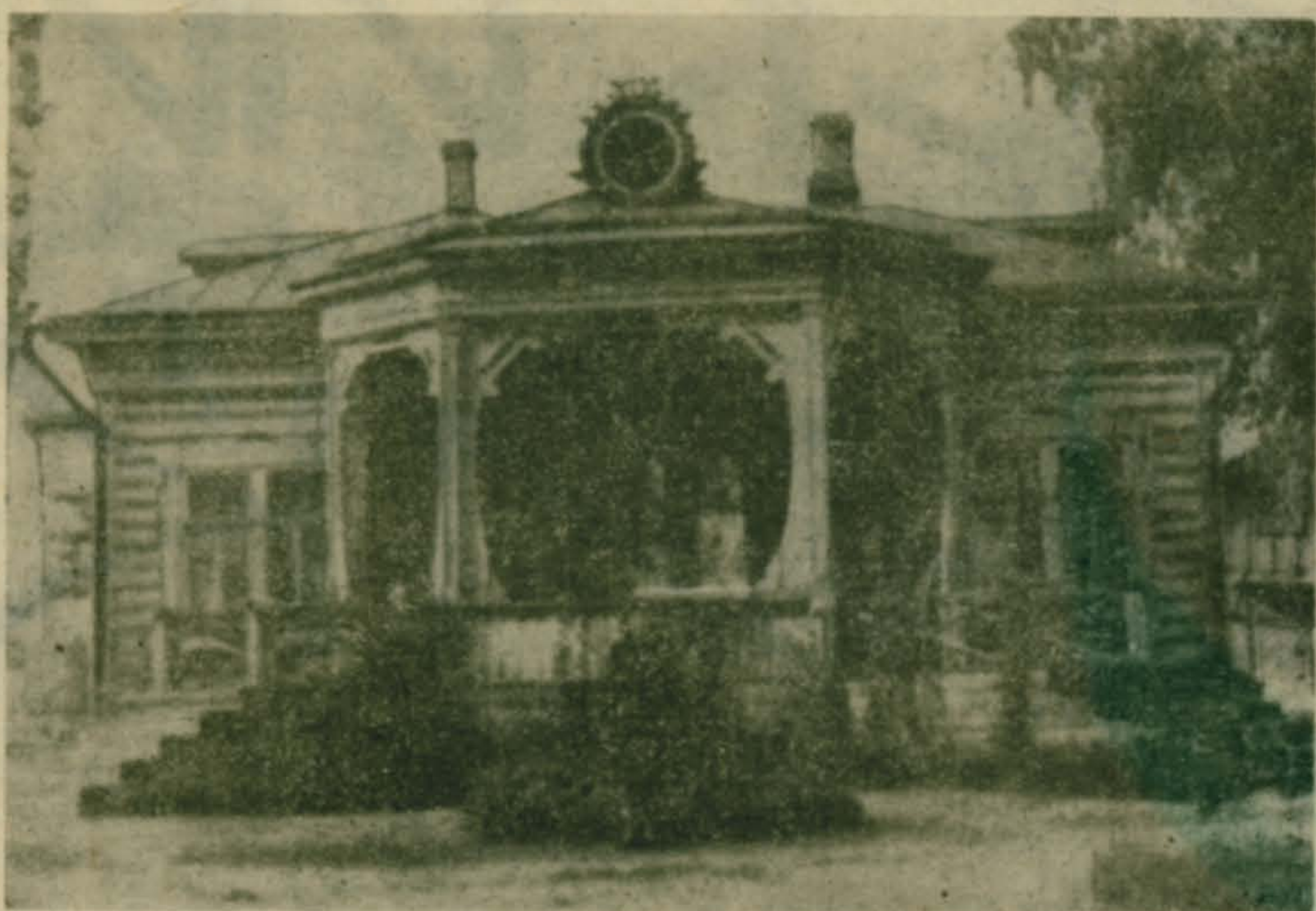
Таким некогда был один из домов на Петропавловской улице (ныне Советской).