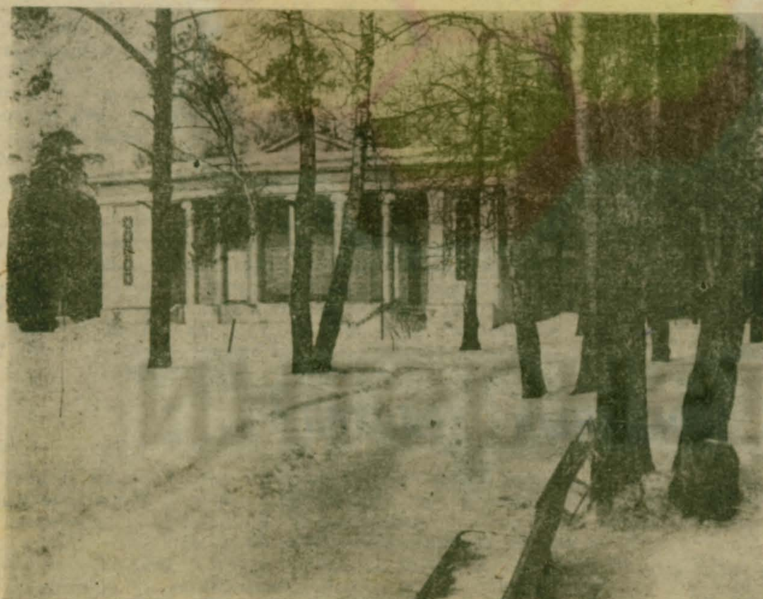
Наша главная достопримечательность — единственный сохранившийся в Подмосковье — Летний театр.

«МАЛАХОВСКИЙ ВЕСТНИК» ЖЕЛАЕТ СВОИМ ЧИТАТЕЛЯМ УСПЕХОВ!