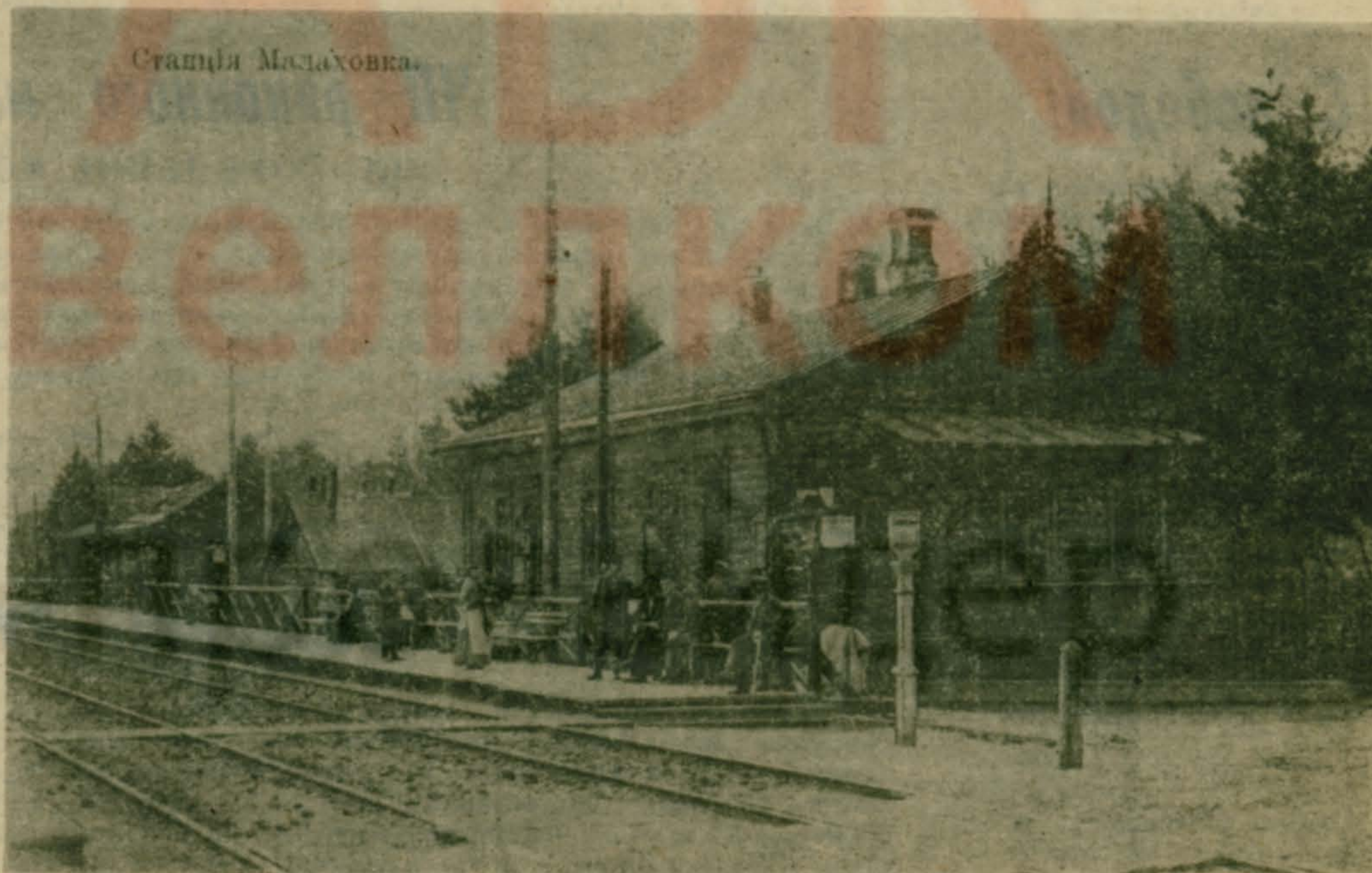
То, с чего началась Малаховка — железнодорожная платформа. На которой стоим и стоять будем.