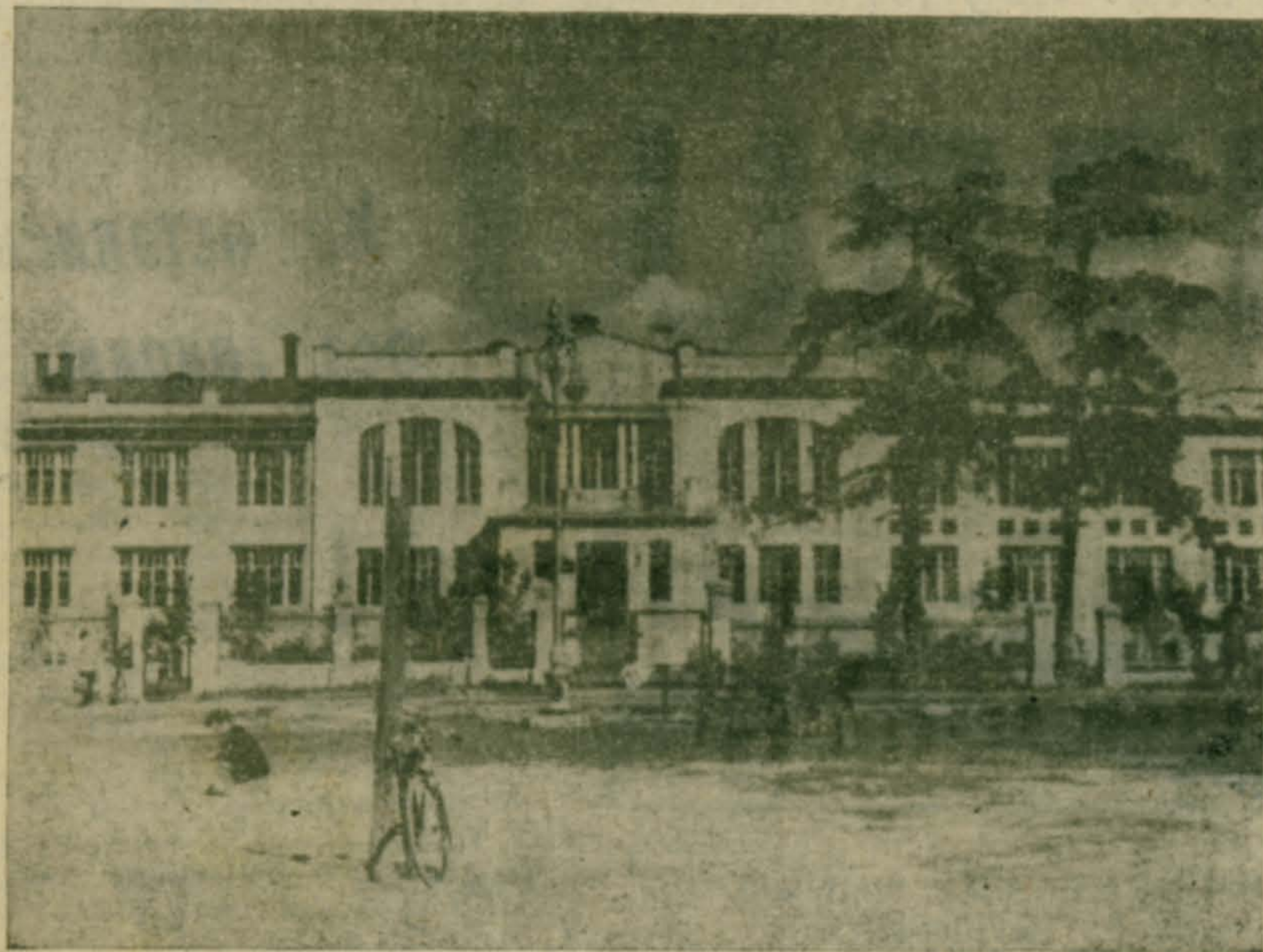
А это школа над оврагом, она же — МОПС, она же — «однокрылая чайка», она же — школа № 5. Сейчас бывшая первая в России сельская гимназия называется школа № 48.