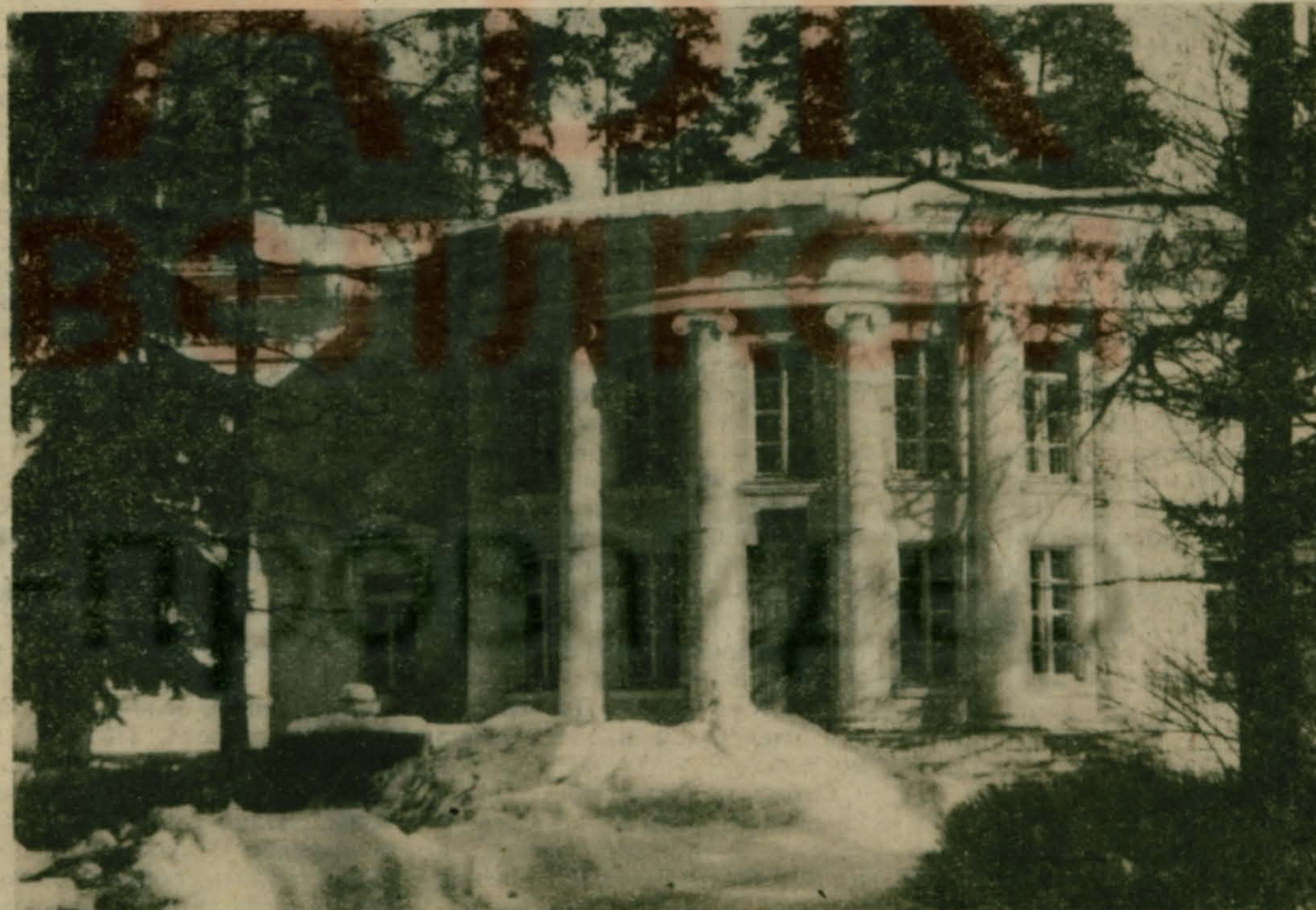
На снимке: детский санаторий МИД, которому исполнилось 50 лет (читайте 2 стр.).