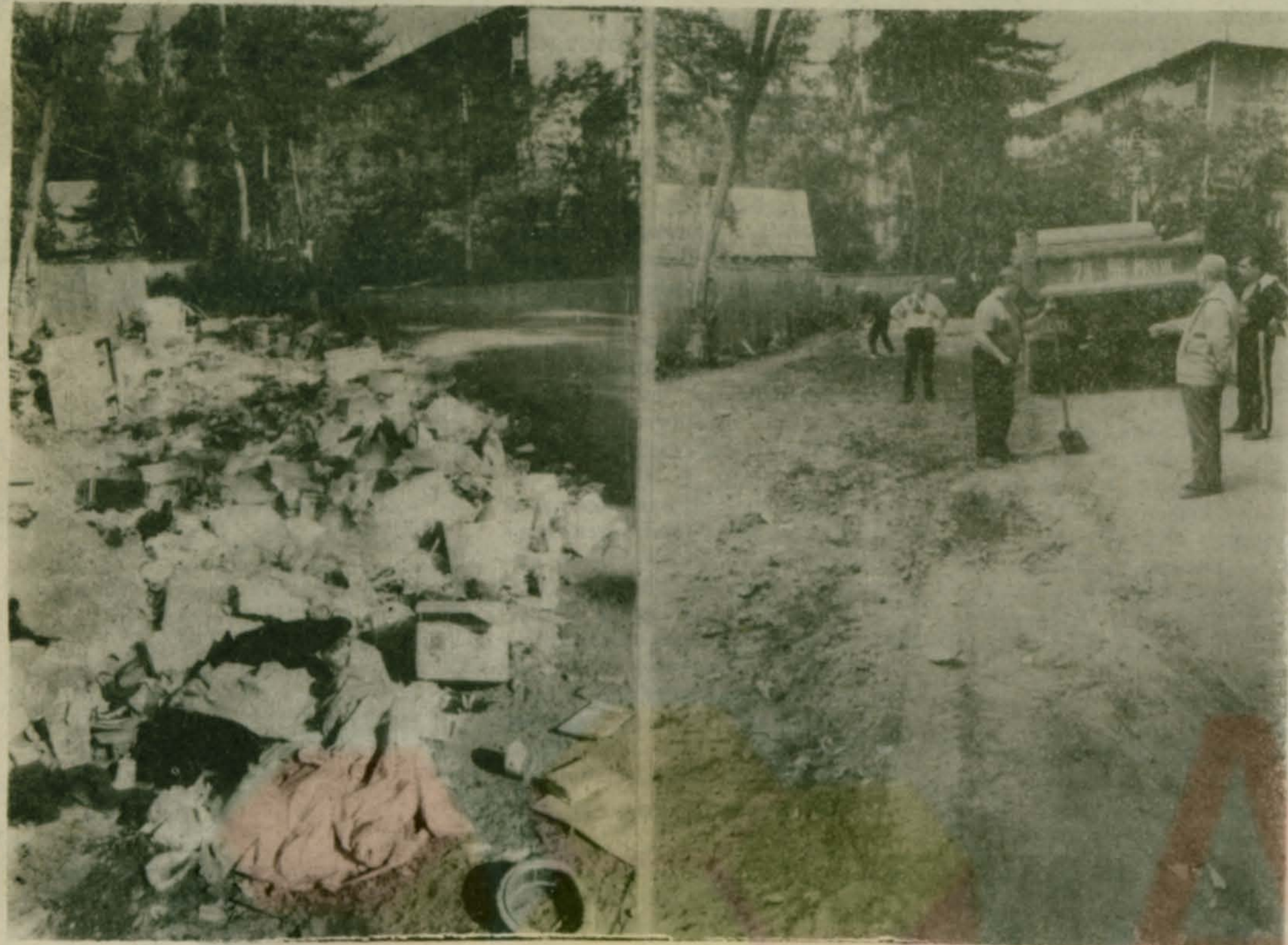
На углу Комсомольской и Федорова: до и после уборки...