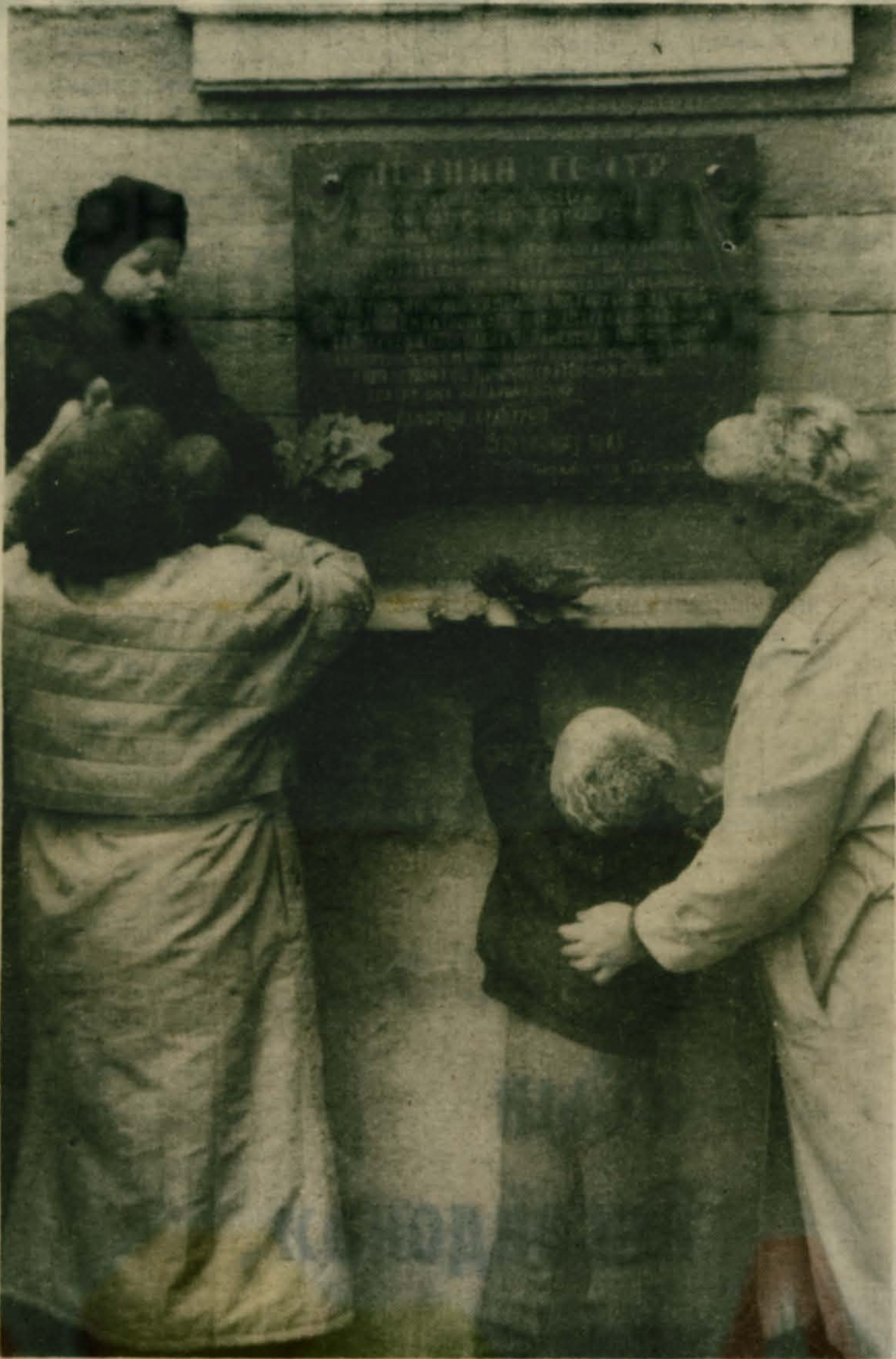
К ГОДОВЩИНЕ ОТКРЫТИЯ МЕМОРИАЛЬНОЙ ДОСКИ НА МАЛАХОВСКОМ ЛЕТНЕМ ТЕАТРЕ.

4 ноября, ПРАЗДНОВАНИЕ КАЗАНСКОЙ ИКОНЕ БОЖИЕЙ МАТЕРИ, 8 час. — Часы. Божественная литургия. 9-е, суббота, 8 час. — Часы. Утренняя. Божественная литургия. 16 час. — Всенощное бдение. 10-е, воскресенье, 8 час. — Утренняя. Божественная литургия.