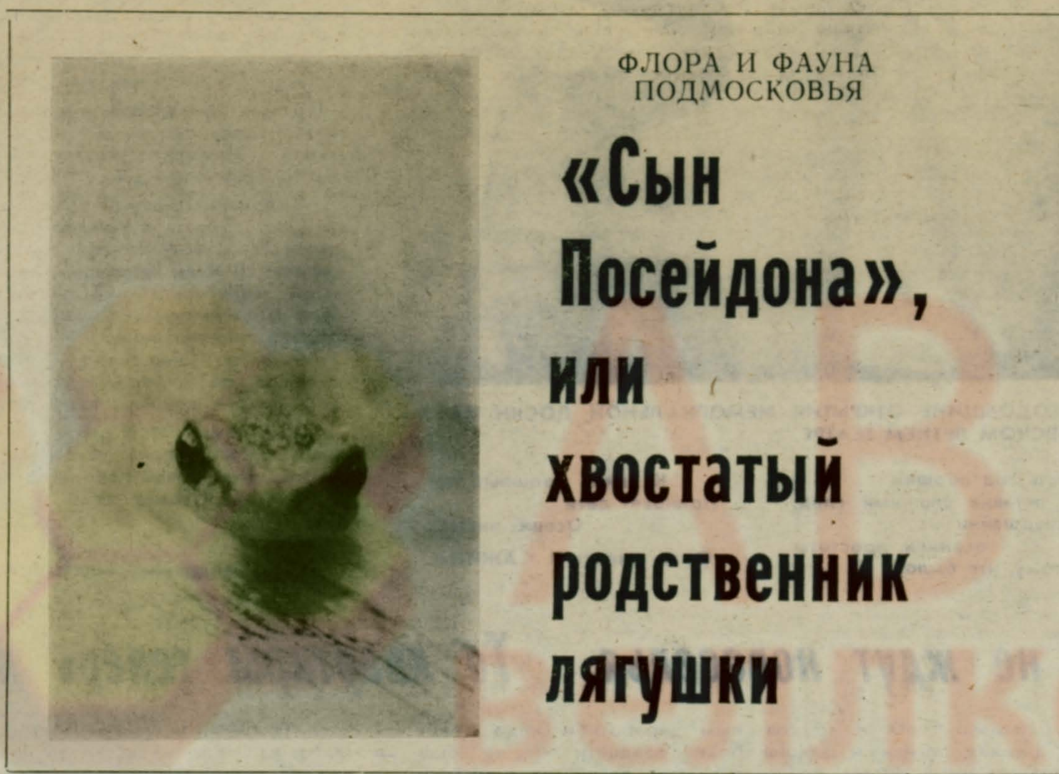
ФЛОРА И ФАУНА ПОДМОСКОВЬЯ

Из 9 видов тритонов у нас встречаются два — обыкновенный и гребенчатый. Живут они во влажных тенистых местах — трухлявых пнях, лесной подстилке, под корой, в норах зверьков и только ночью выползают на охоту за многоножками, дождевыми червями и гусеницами. Прodelьвают они это неторопливо, деликатно переступая на тонких ножках и