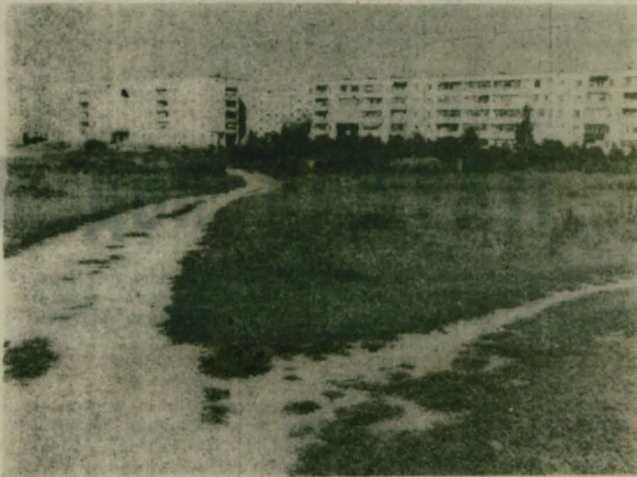
Дороги, пустыри, рощи, овраги — все требует нашей заботы...

в этот день, 19 апреля, «Малаховский вестник», как и все, будет заниматься генеральной уборкой на прилегающей территории. Можете зайти к нам, если у вас появится срочное сообщение или желание подписаться на следующее полугодие в качестве альтернативного подписчика (стоимость «Малаховского вестника» для «альтернативщиков» — всего 10200 рублей на шесть месяцев). Если у вас не бывает на это времени в рабочие дни — добро пожаловать в в нынешнюю субботу!