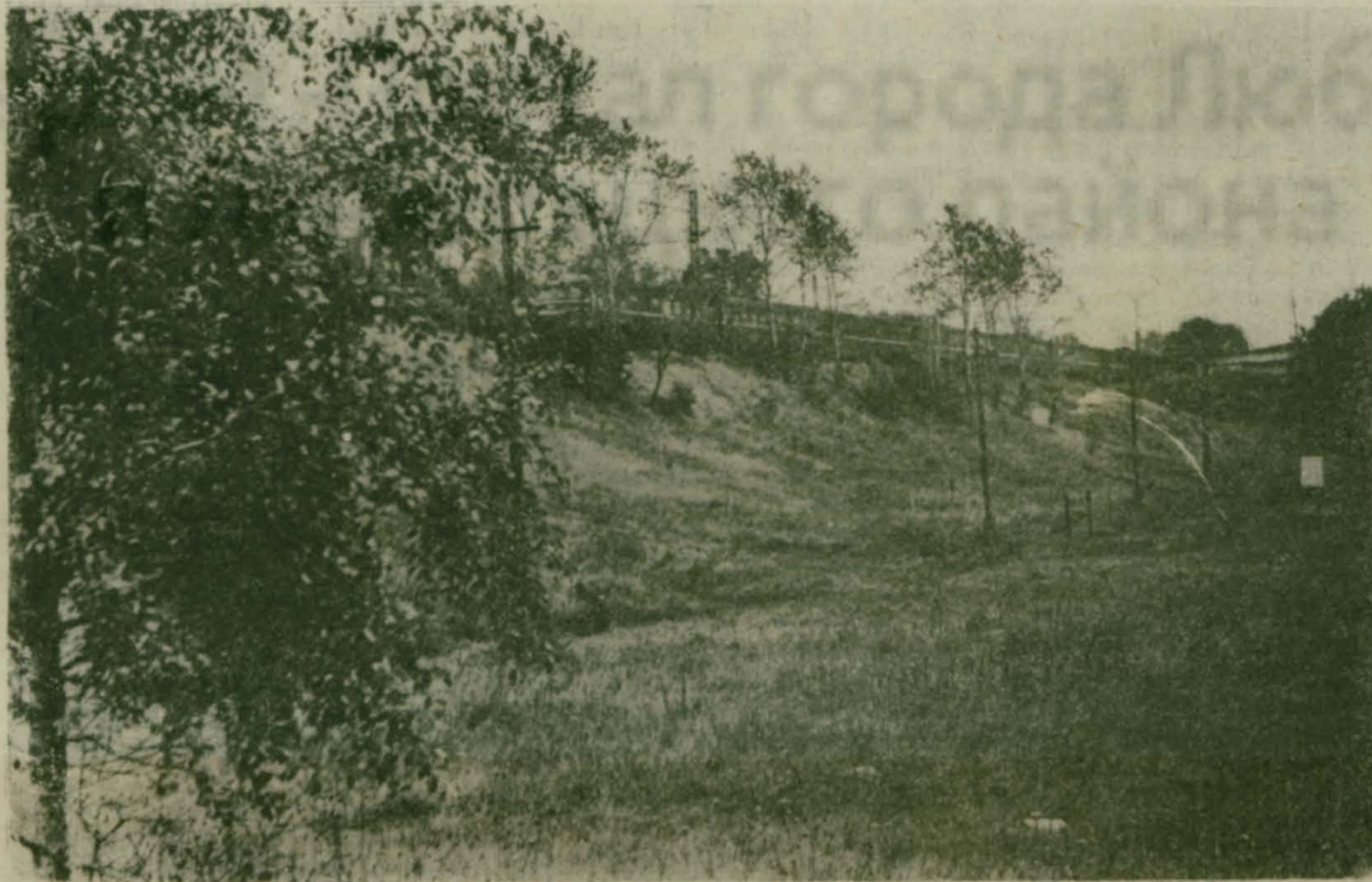
Электричка, везущая и малаховских пассажиров.